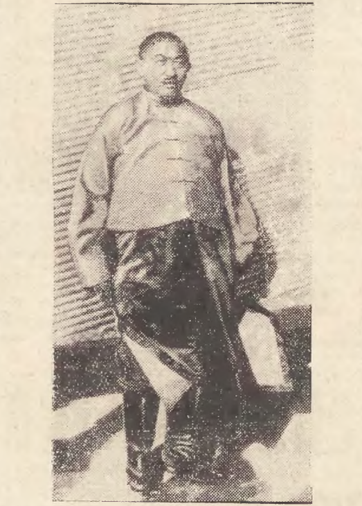
Panshan Dalaj Lama, Świątobliwość i głowa buddystów tybetańskich, postanowił spróbować lotu na aeroplanie. Tybet jest krajem najbardziej konserwatywnym i najbardziej zacofanym jednocześnie. Nic więc dziwnego, że postanowienie, czczonego niby nawoju Boga, Dalaj Lamy, wywołało wielkie wrażenie w kraju. — Lama latał na amerykańskim aeroplanie i jak twierdzi, zchwycony jest swoją pierwszą próbą

Zresztą, jeżeli cofnąć się myślą wstecz, do czasów szkoły rosyjskiej, znajdziemy tam t. zw. pomocników wychowawców klasowych, a w gimnazjach żeńskich — damy klasowe, których wyłącznym zadaniem była praca wychowawcza.