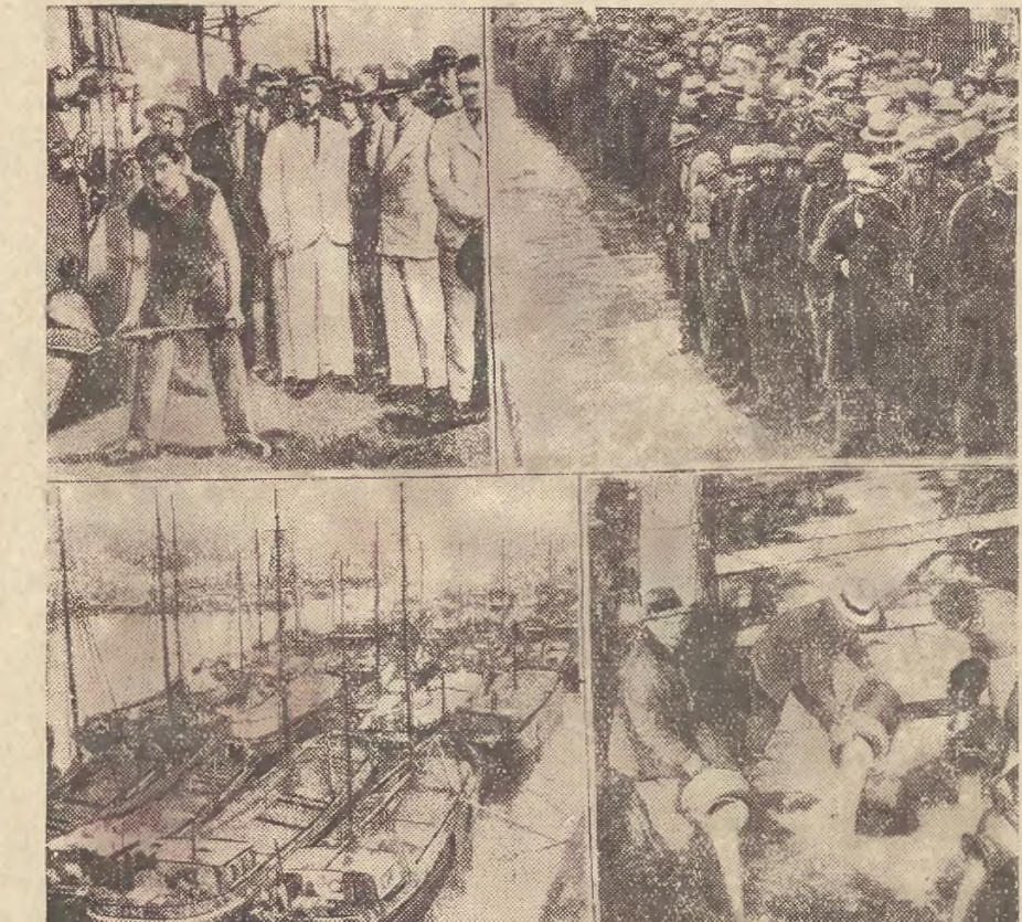
Czy wszechświatowa konferencja ekonomiczna w Londynie przyczyni się do zbawienia gospodarki świata? Dotychczas było tak: kawa brazylijska spalana w piecu, celem sztucznego podniesienia cen; okryty w liczbie tysięcy ton stoją w portach beczynnicy; farmerzy amerykańscy wylewają nadmiar mleka, którego wartość równa się zeru i — setki tysięcy bezrobotnych stoją w kolejkach w oczekiwaniu darmowych obiadów.