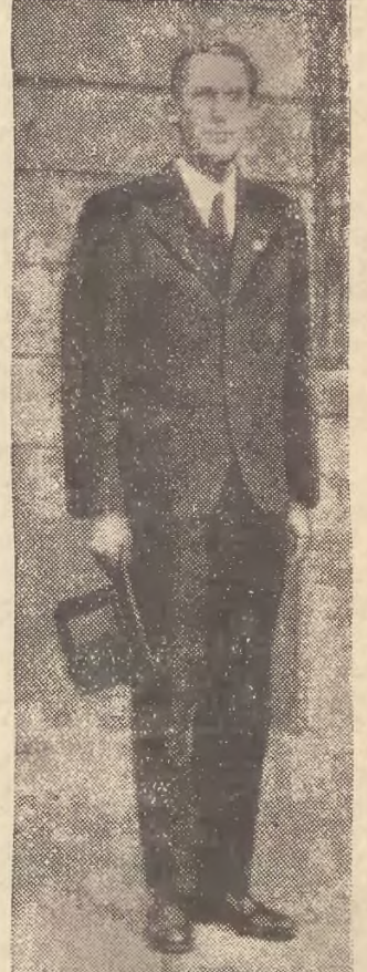
Przewodniczący delegacji niemieckiej na konferencji gospodarczej w Londynie, burmistrz Hamburga Krogmann.

Niechaj ta konferencja natchnie nową odwagą i nowym zaufaniem świat cały, niech będzie kresem naszego blądzenia po omacku i nieudolnej polityki.