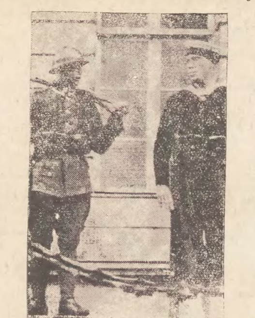
Dnia 28 ub.m. o godz. 13 odbyło się z okazji Święta Morza zaciągnięcie warty plutonu Szkoły Morskiej przed Komendą Miasta w Warszawie. Zdjęcie przedstawia moment zmiany warty.