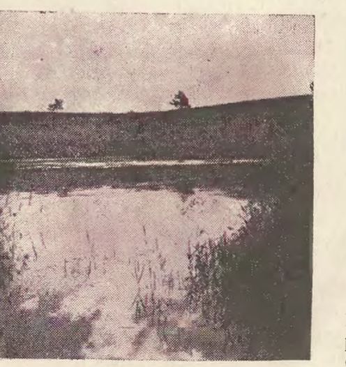
Zejmiana pod Pohulaną. znajdzie tutaj dla siebie rzeczy interesujące; przyrodnic — ciekawą florę, historyk interesujące zabytki w naszych miasteczkach, etnograf, społecznik i artysta, będą mieli tutaj pole do obserwacji i badań. Włóczęga więc po naszych stronach może się stać nie tylko rozrywka sportową.

Wileńszczyzna jest idealnym terenem dla sportu kajakowego, turystycznego. Wielka ilość rzek i rzeczek, piękne jeziora ciągnące się nieraz dziesiątkami kilometrów, tworzą naturalne szlaki w kraju, którego piękno, niestety zbyt mało jest jeszcze spopularyzowane i który pod każdym względem zasługuje na jaknajszczęśliwsze poznanie. Każdy