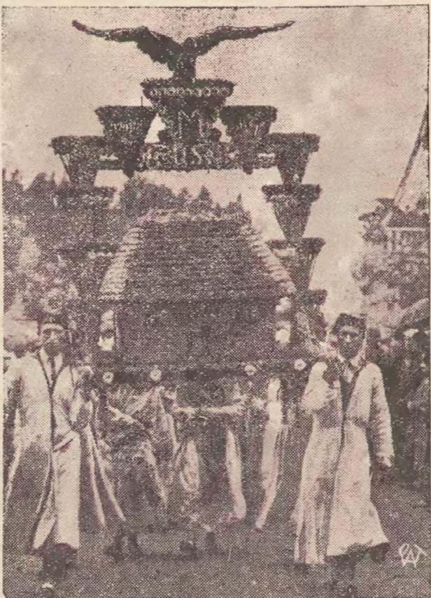
Delegacja wieńcowa z Krosna niesie dary żniwne Dostojnemu Gospodarzowi, Pannę Prezydentowi Rzeczypospolitej.

Stany Zjednoczone do czuwania nad utrzymaniem ładu i porządku publicznego na Kubie.