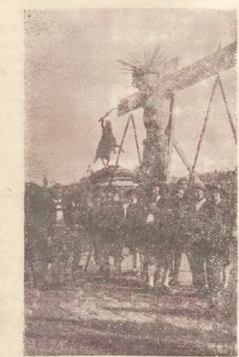
Pochód Tyrolczyków (Wildschmaren) z ozdobnym drewnianym krucyfikssem.

Więć ci Wiedeńcy, ci Austriacy dotąd pamiętają i kochają Franza Josefa?