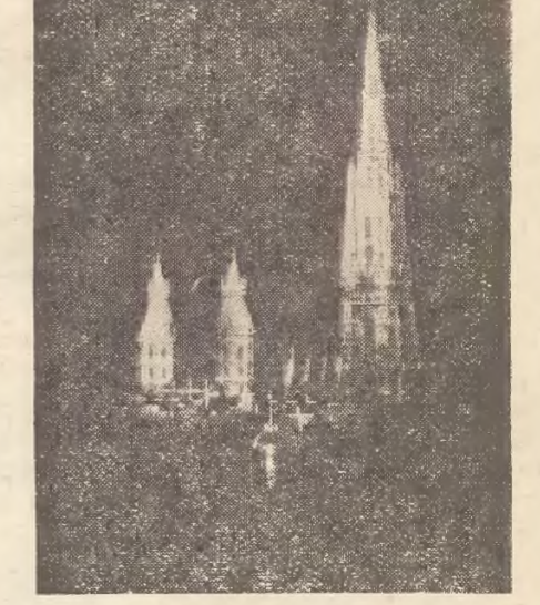
Iluminacja kościoła św. Stefana w noc z dn. 11 na 12 września 1933 roku.

Bez końca. A obok tych fotografij, tu i tam, stare zdjęcia z Kaiserzeit. Schönbrunn i Franz Josef w białym mundurze, w kasce z pióropuszem; karaoca dworska wyjeżdżająca z Burgu; zmiana warty przed Burgiem; parada wojskowa, i na tle Deutschermeisterów pochylona postać starego cesarza. Wiedzieć czy więc zachowując go w pamięci. Bo, rzeczywistość, mało mu Wiedeń zawdzięcza? Te gmachy opery, parlamentu, ratusza, Votivkirche, uniwersytetu, Burgteatru; to monumenty Radetzky'ego, Marji Teresy, księcia Sabaudzkiego, arcyksięcia Karola — całe Ringi, których