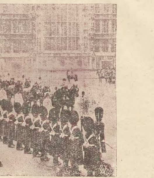
Parł Królowa w drodze do Parlamentu.