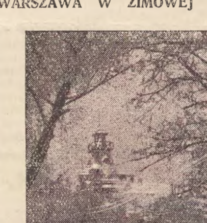
W Warszawie w zimowej szacie. Widok z ulicy.