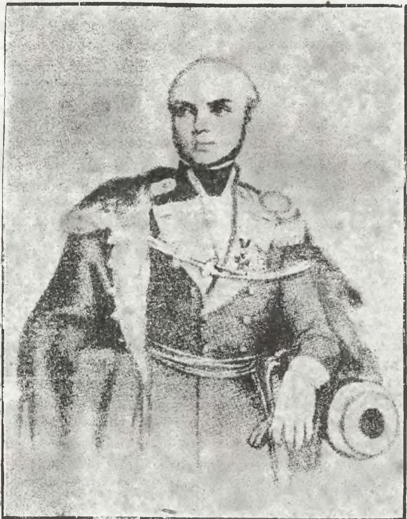
GENERAL JÓZEF BEM wedle fotografii z 1849 r.

— Wehódza w wąwóz i toną... wychodzą w światło księżyca I czernieją na niebie, a blask ich zimny omusnął, I po ostrzach jak gwiazda spaść niemogąca prześwieca.