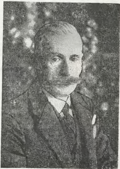
Świeżo mianowany prezydent Sądu Apelacyjnego p. Wójcicki.