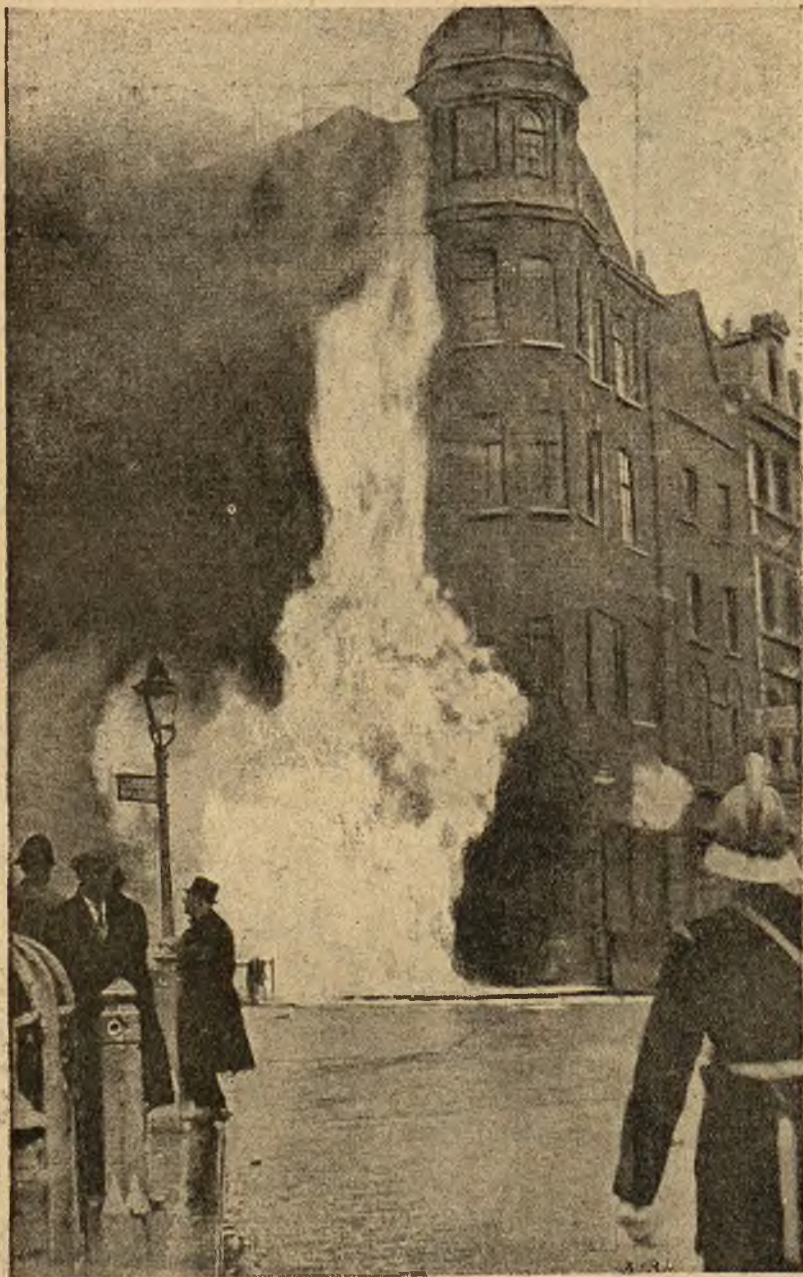
Wybuch gazu na ulicach Londynu: słup płonącego gazu, który wydobył się z pękniętej rury, sięgał wysokości czteropiętrowej kamienicy.