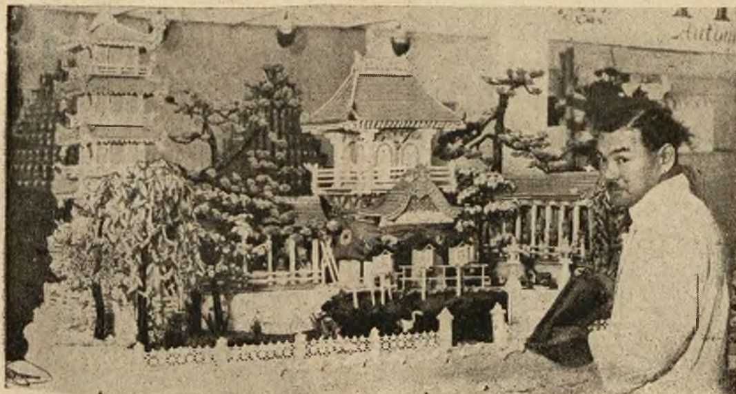
Pewien cukiernik japoński wykonał to arcydzieło z kolorowego cukru. Jest to pagoda japońska, zupełnie jadalna.