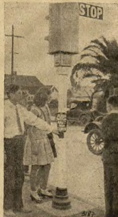
Na ulicach w Los Angeles ustawiono przed szkołą aparat, przy pomocy którego dzieci szkolne mogą same zatrzymywać ruch kołowy na jezdni.