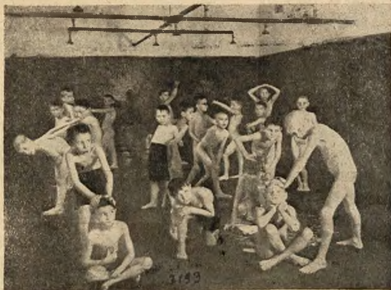
Troska szkoły o czystość ciała dzieci. Uczniowie Szkoły Pow. Męsk. im. Kordeckiego we Lwowie używają kąpeli natryskowej w szkole.