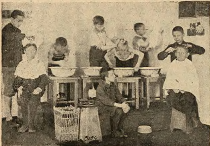
Koło Młodzieży Pol. Czerw. Krzyża Szkoły Pow. Męskiej im. Kordeckiego we Lwowie strzyże członkom swoim zaniedbane fryzury i myje niepoprawnych brudasów.