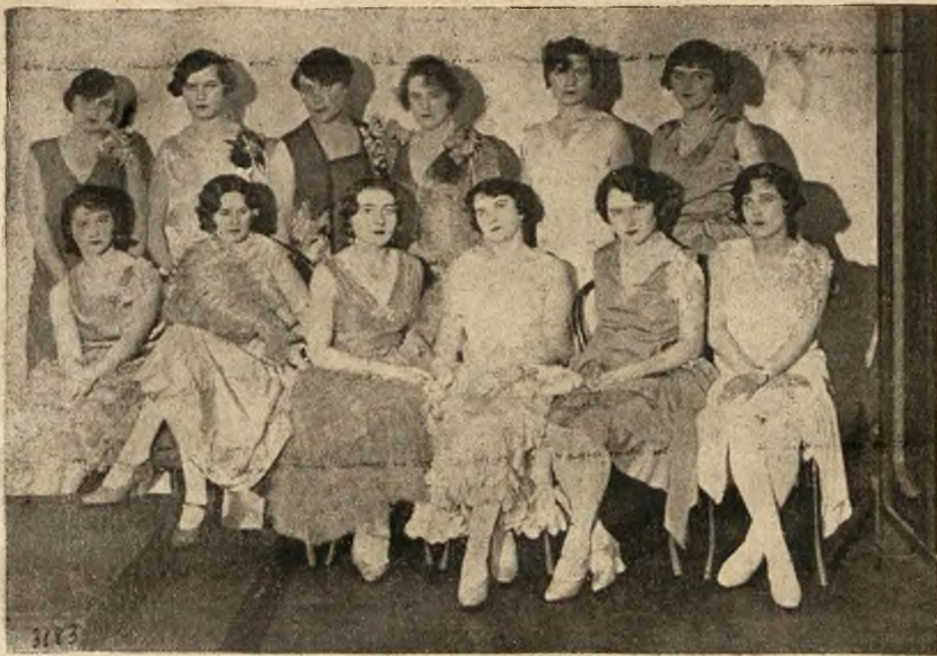
Wesoły Sylwester odbył się w Kasynie i Kole lit art. we Lwowie w połączeniu z piękną imprezą artystyczną, w której wzięły udział panie z towarzystwa (nasza rycina).