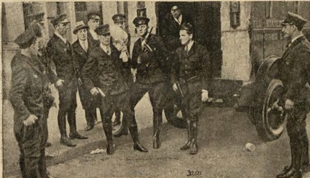
W otoczeniu uzbrojonych policjantów przewożono w wozie pancernym sumę 650 milionów dolarów z banku w dzielnicy Broadway do banku w dziel. Old Madison Square w N. Jorku.