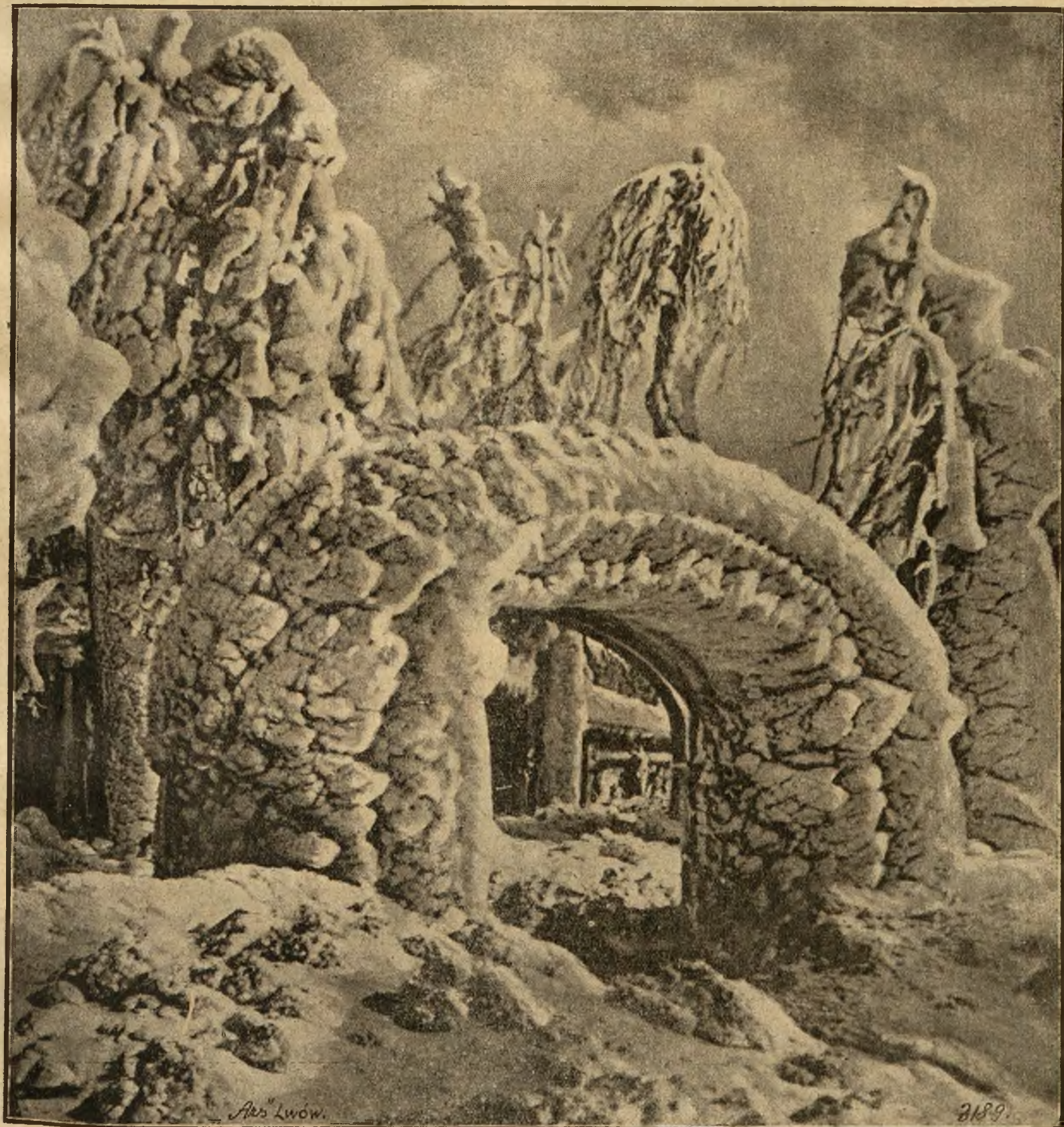
Zima jest mistrzowskim dekoratorem. Oto bajkowy obraz zimowy w okolicy wodospadów Niagary w Stanach Zjednoczonych. ]