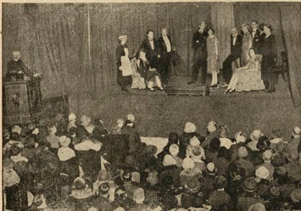
Powrót do średniowiecza. W kościele św. Pawła w Londynie zaimprovizowano przedstawienie teatralne, dając sztukę pisarza angielskiego Jerome K. Jerome'a. Proboszcz kościoła wygłosił w czasie przedstawienia z ambony kazanie o moralności teatru.