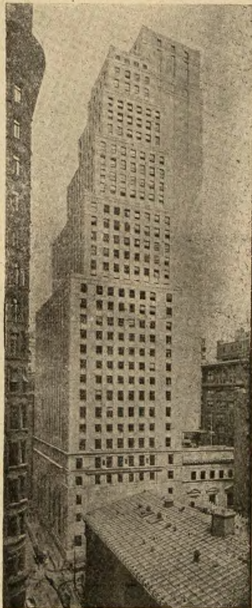
Jeden z najnowszych „drapaczy chmur“ w Nowym Jorku: gmach banku w kształcie stopni.