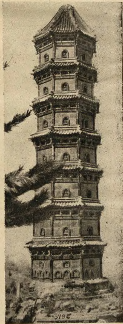
Zielona pagoda porcelanowa w cesarskim Ogródzie Myśliwskim w Pekinie.