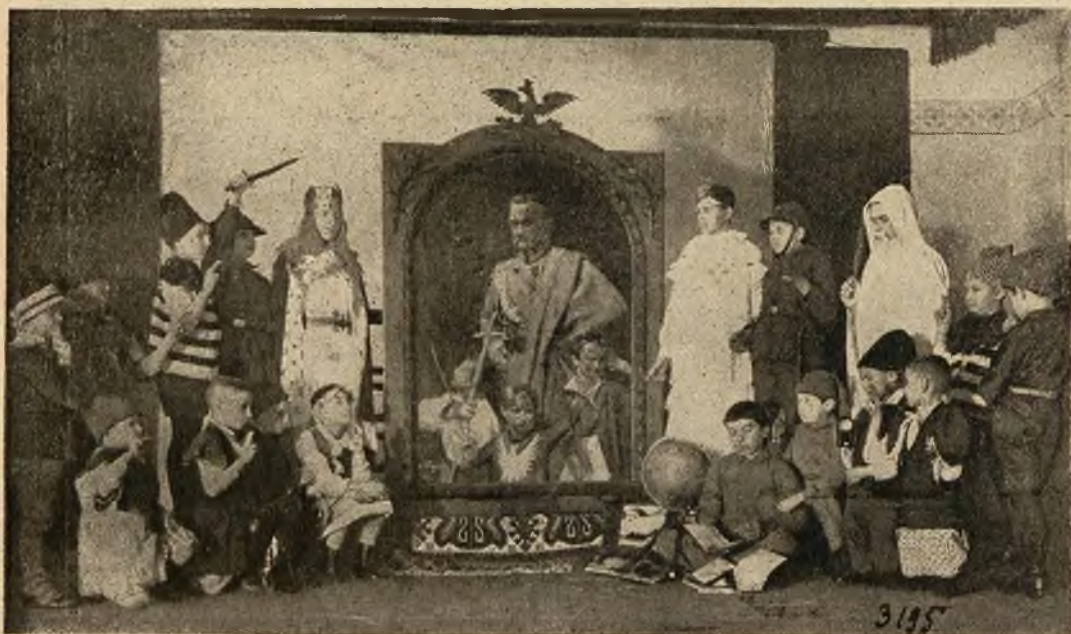
W szkole im. Konarskiego we Lwowie złożyły dzieci hołd marszałkowi J. Piłsudskiemu.