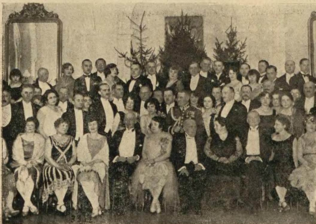
Grupa uczestników Balu Prasy we Lwowie dnia 2 lutego 1929.