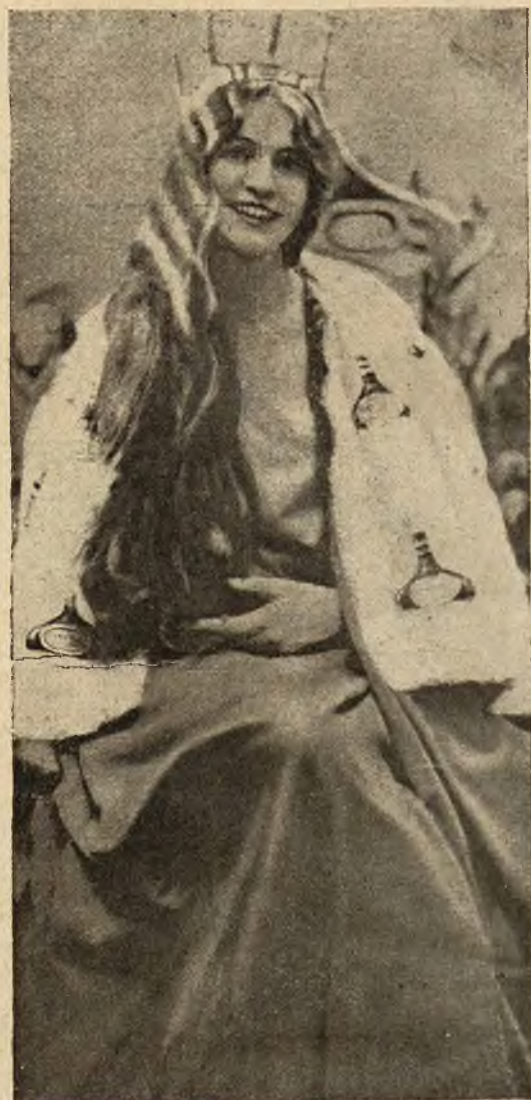
Ukoronowana niedawno „Królowa Pixavonu“ otrzymała nagrodę w kwocie 6 tysięcy złotych, engagement do filmu, willę nad jeziorem i kilka propozycji małżeńskich.