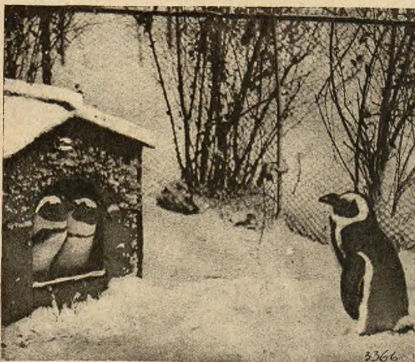
Pingwiny, zamknięte w zagranicznych ogrodach zoologicznych, stwierdzają z radością, że tegoroczna nadzwyczaj ostra zima w Europie nie różni się prawie zupełnie od zimy w krainach podbiegunowych.