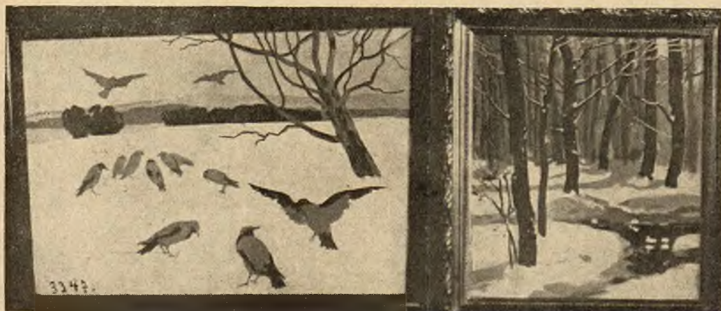
Z pracowni malarskiej artystki-malarki Sabiny Jankowskiej: 1) Wrony. 2) Potok w lesie. (Do artykułu wewnątrz numeru).