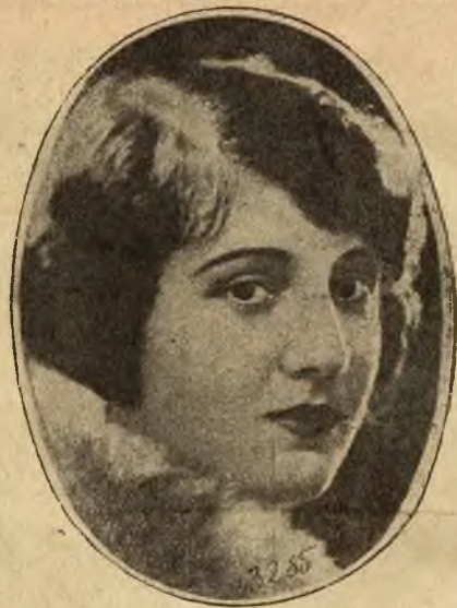
Sen. del Carmen Froes, królową piękności Kuby.