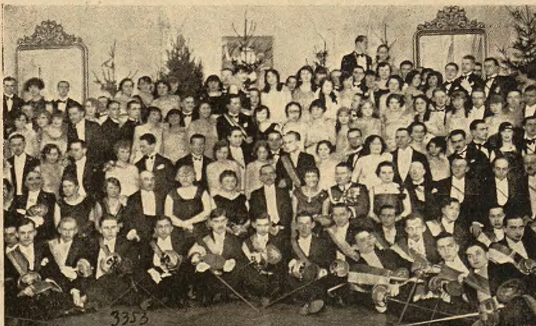
Uczestnicy Balu reprezentacyjnego Korporacji akademickich we Lwowie