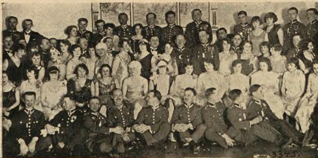
Uczestnicy Balu 5 pułku artylerji polowej we Lwowie.