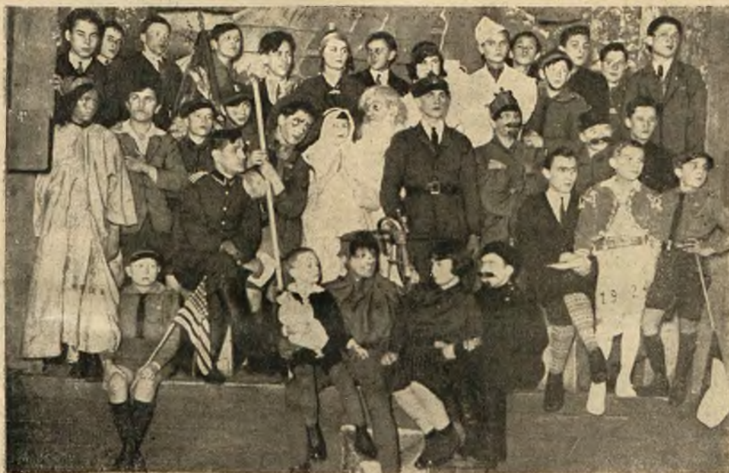
Staraniem XII drużyny harcerskiej przy szkole męskiej im ks. Kordeckiego we Lwowie została odegrana dnia 20. I. 1929 „Szopka harcerska”, obraz sceniczny w 3 aktach J. Brauna. (reżyserja K. Kuzilcka).