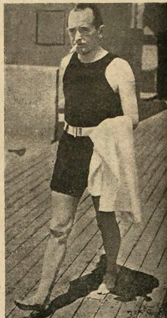
Amerykański „król tytoniu” Benjamin Newton Duke zmarł w tych dniach, pozostawiając majątek w kwocie 5 miliardów złotych.