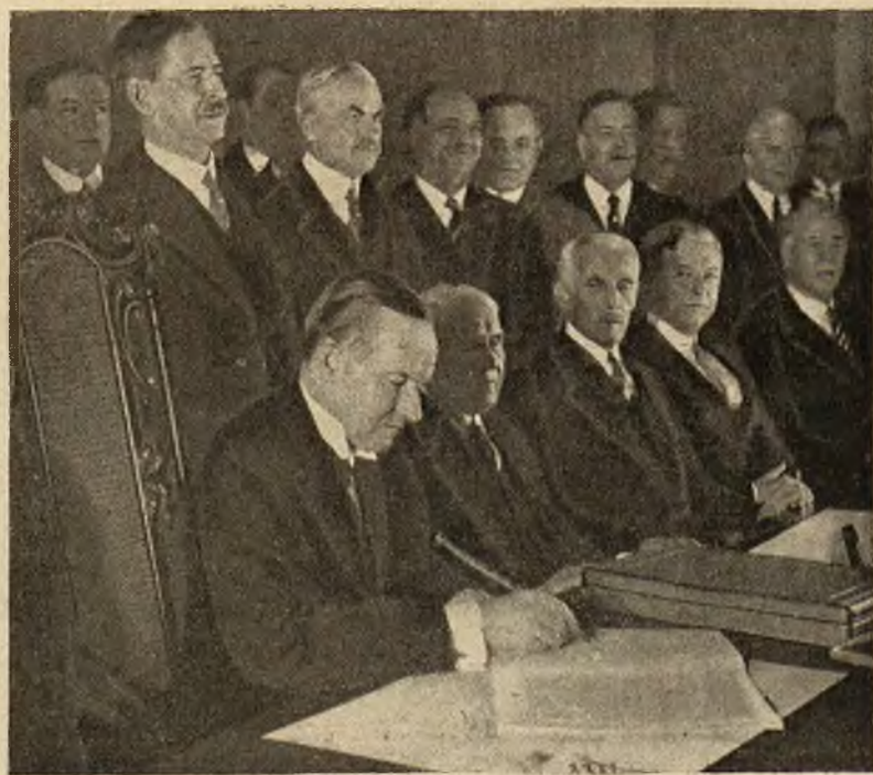
Prezydent Stanów Zjednoczonych, Calvin Coolidge, podpisuje pakt Kelloga piórem, ofiarowanym mu przez miasto Havre. Z lewej jego strony siedzi p. Kellog, amerykański minister spraw zagranicznych.