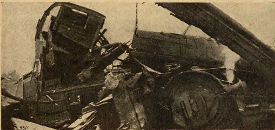
Katastrofa kolejowa wydarzyła się niedawno w Anglii. Pociąg pospieszny Bristol-Nottingham zderzył się z pociągiem towar. z powodu gęstej mgły. Zabitych 6 osób rannych 50.