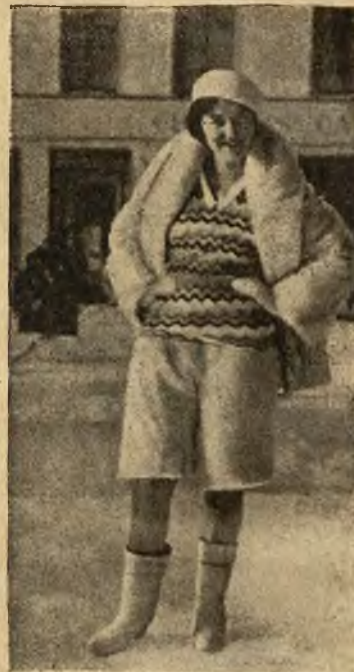
Moda sport. dla pań na placach sport. w Davos.