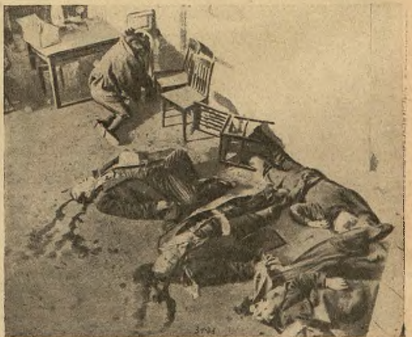
W Chicago rozegrała się krwawa walka dwóch szajek bandytów. Zwycięska partja zapędziła swoich przeciwników pod ścianę i wybiła ich do nogi z karabinów maszynowych.