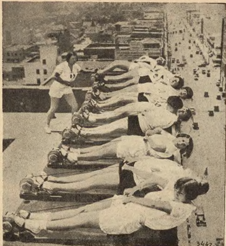
W Ameryce nic bez sensacji. Urzędniczki biurowe ćwiczą wyciszenie przy przerwy południowej na dachu jednego z drapaczy chmur.