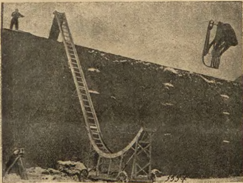
Panna Brigita Leinert wykonuje niebezpieczny „węzeł śmierci“ na saneczkach z toru wysokości 15 metrów.