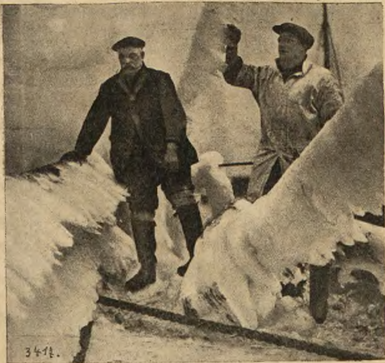
Statek rybacki „Water Priory“ przybył z morza Północnego do London Bridge, pokryty lodem. Okręt robił wrażenie okrętu widmowego.