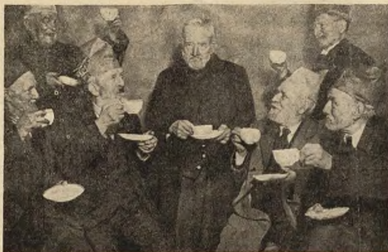
„Klub dziadków“ w N. Jorku święci 80-lecie urodzin jednego z swoich członków tradycyjną kawą.