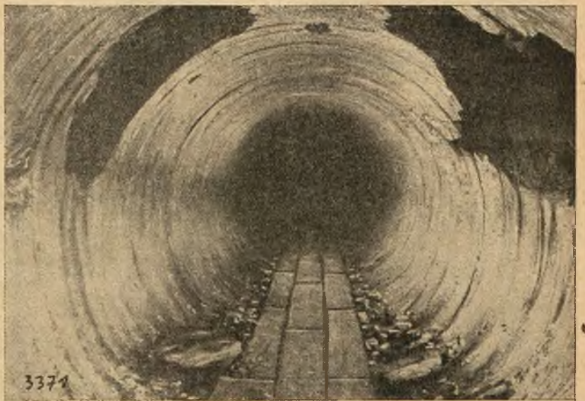
Projekt tunelu pod kanałem La Manche jest obecnie żywo omawiany. Rycina nasza przedstawia pierwszą dawną próbę zbudowania tunelu po stronie angielskiej. Roboty później zarzucono.