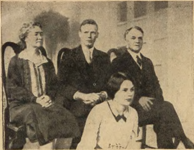
Znany lotnik Lindbergh zaręczył się niedawno w Meksyku z miss Anną Morrow córką ambasadora Stanów Zjednoczonych w Meksyku.