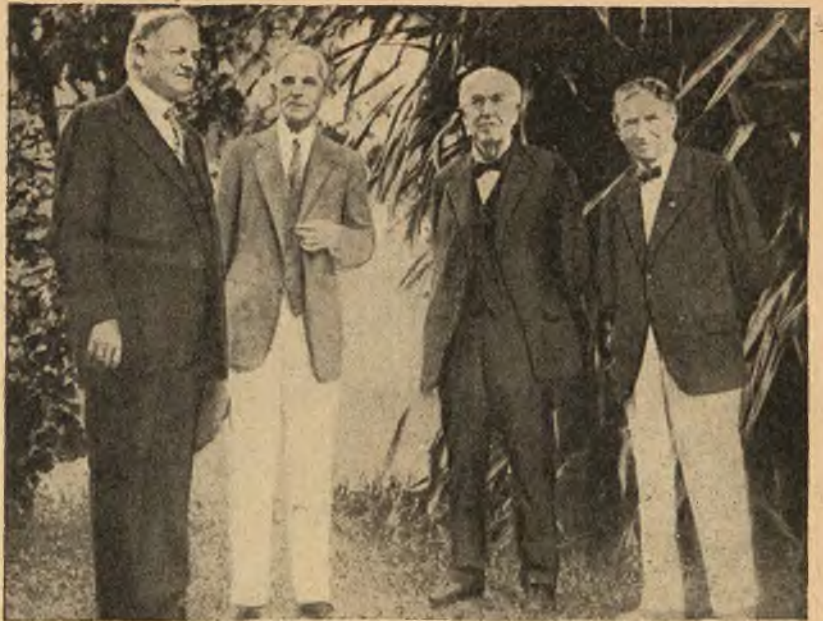
W 80-lecie urodzin Edisona odwiedzili słynnego wynalazcę najśłynniejsi Amerykanie. Od prawej strony: prezydent Herbert Hoover, król samochodowy Henryk Ford, Edison i Harvey S. Firestone.