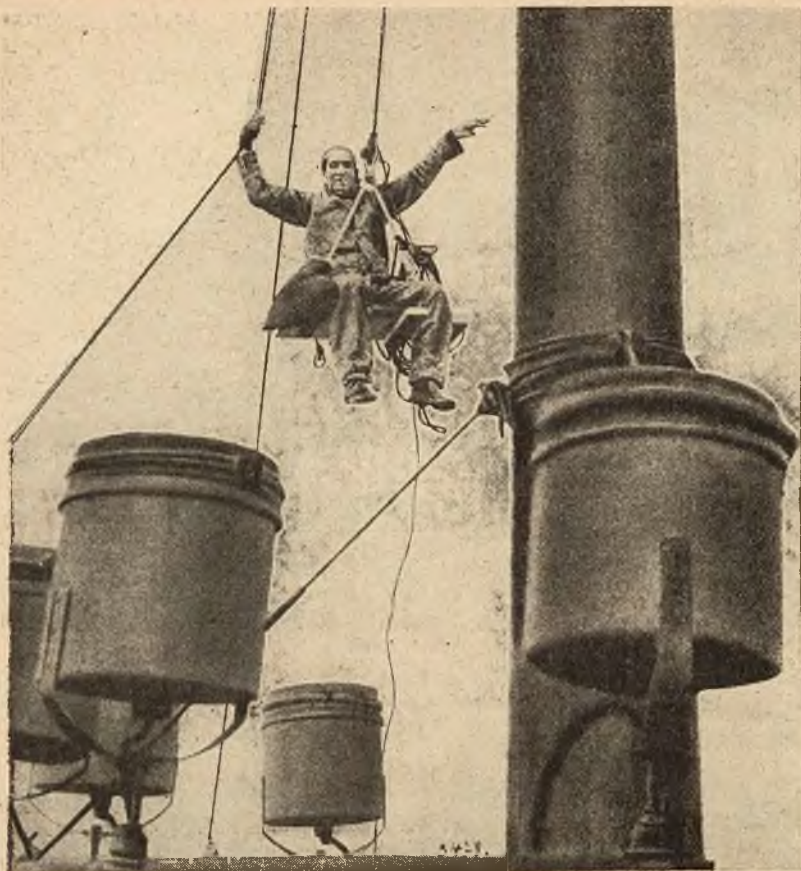
Ameryka jest krajem najbardziej osobliwych rekordów. Rycina nasza przedstawia człowieka, który przez 12 dni siedział na specjalnej ławeczce, umieszczonej na maszcie chorągwanym hotelu Morrisona w Chicago i zdobył rekord.