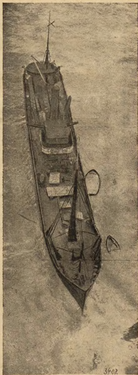
Francuski parowiec „Le Crabe“ natknął się na skały w angielskim kanale. Parowiec zatonał, załogę w liczbie 16 osób uratowano.