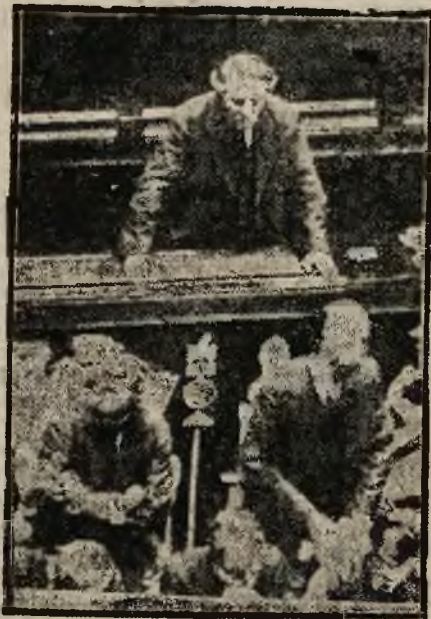
Arystides Briand, francuski premier i minister spraw zagr. odczytuje w Izbie deputowanych oświadczenie nowego rządu.