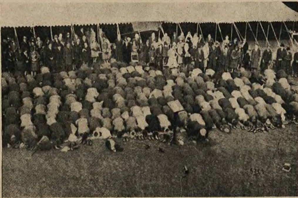
W miejscowości Woking, koło Londynu, odbyła się uroczystość muzułmańska. Rycina nasza przedstawia Muzułmanów w czasie modlitwy. Na przednim planie mikrofon, w tyle przyglądająca się ceremonii publiczność europejska.