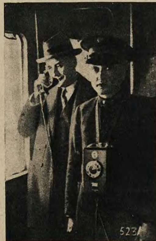
W Neapolu przynosi się podróżnym aparat telefoniczny do pociągu. Aparat ten łączy się z najbliższą stacją na dworcu.