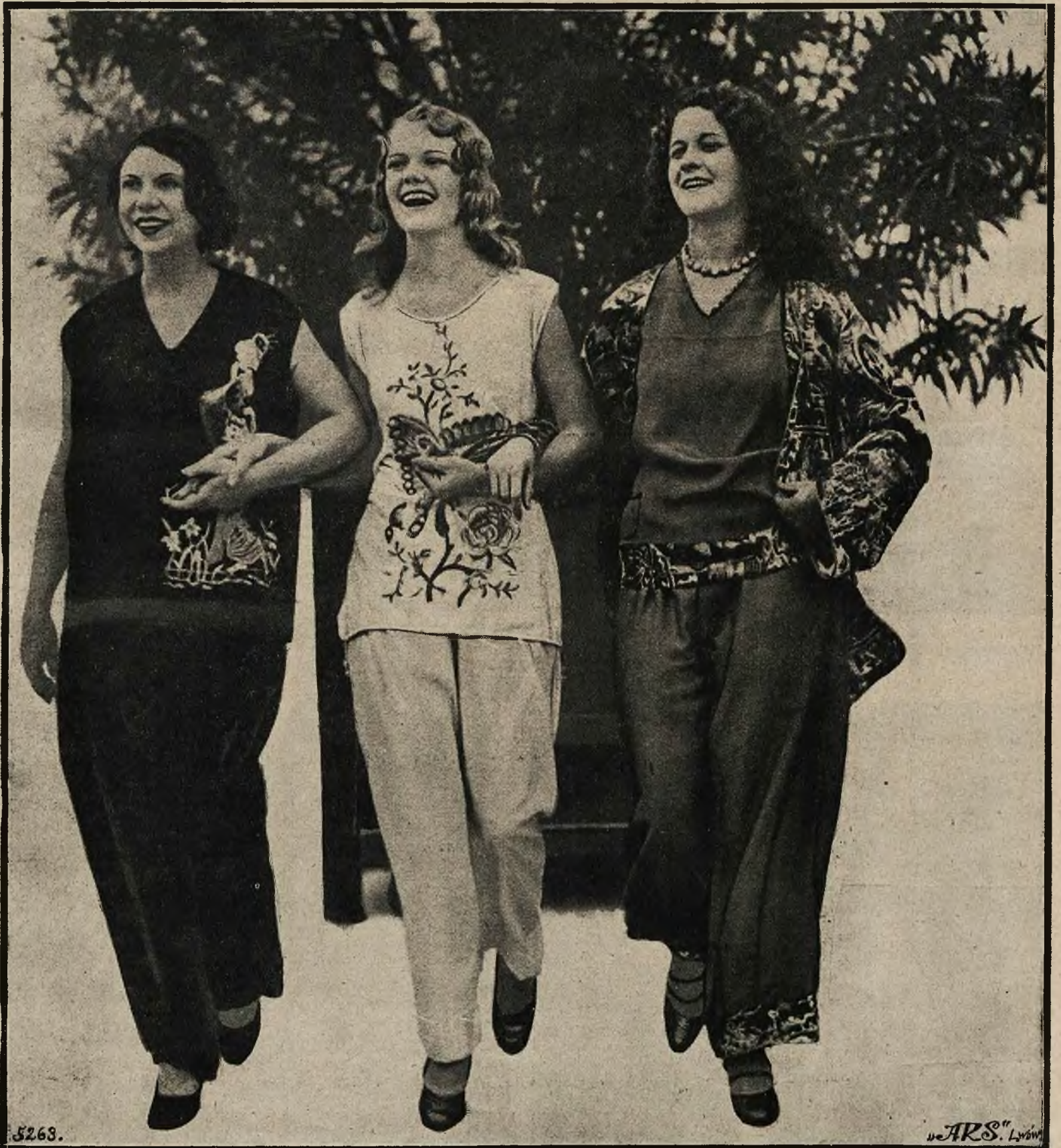
Rewja najnowszej mody letniej odbyła się w miejscowościach kąpielowych na Florydzie (Kalifornia), gdzie pyżamy należą do najważniejszych strojów. Trzy „manekiny“ pokazują najnowsze kreacje mody kąpielowej.