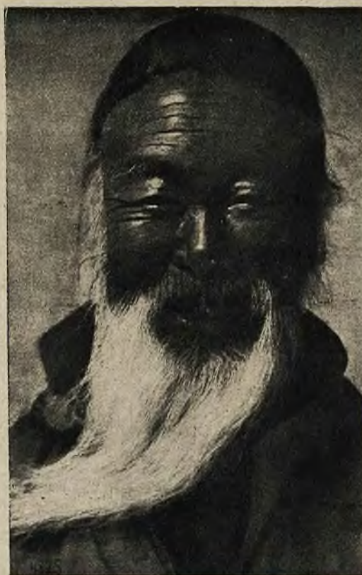
Typ starego Mongoła, opalonego w słońcu pustynnym. Ile ma lat niewiadomo. Ale jest zdrow jak ryba i wiecznie uśmiechnięty.