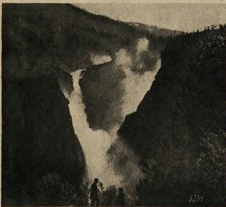
Wodospad Rjukanpos (125 m. wysokości) w Norwegji, którego siła wodna dostarczyć ma 800,000 kilowatów energii elektrycznej. Ryc. obok: Kruczki przemytników am.: narkotyk w kształcie kostek cukru. W ten sposób chciano przemycić narkotyki wartości 5 mil. dol.