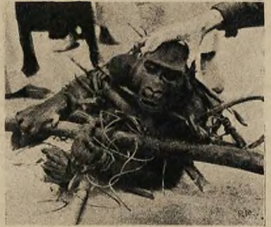
Rzadka zdobycz. Schwytyany w dżunglach goryl, którego musiano mocno skrępować, aby go móc odwieść.