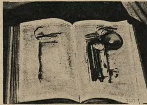
Kruczki amerykańskich przemytników: biblia w której przemycano morfinę.