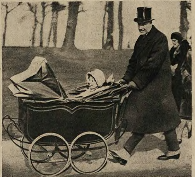
Rycina] obok: Spleen lordów angielskich: lord Gorell, członek Izby panów, w czasie przechadzki niedzielnej w londyńskim parku Hyde obwozi w kołesce swoje dziecko.