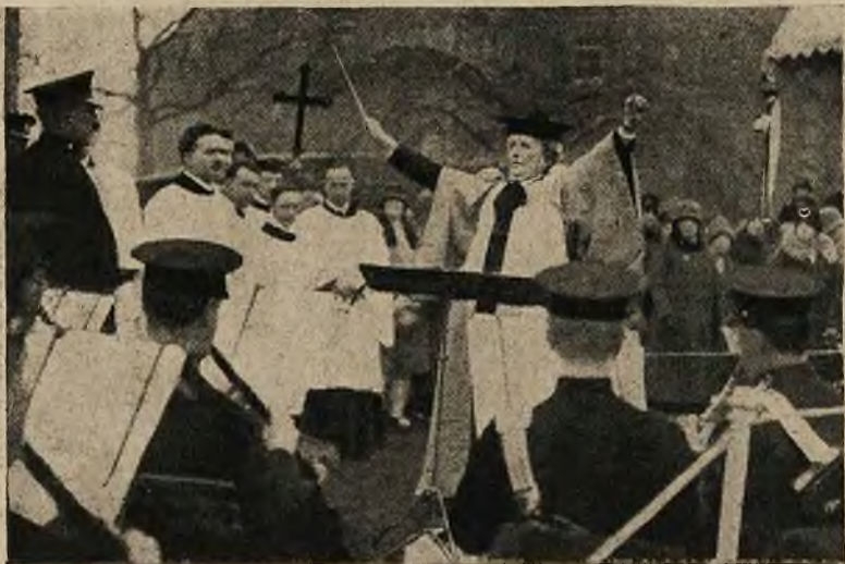
Niedawno odbyło się w Londynie odsłonięcie pomnika słynnej sufrażystki angielskiej pani Pankhurst. Najciekawszym w czasie tej uroczystości było to, że orkiestrą policyjną dyrygowała dawna sufrażystka angielska pani Ethel Smythe.