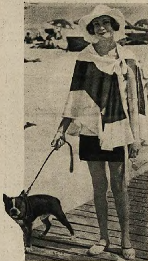
Najnowsze kreacje mody kąpielowej: wielki szal wełniany do rozścielania w czasie kąpieli słonecznej.