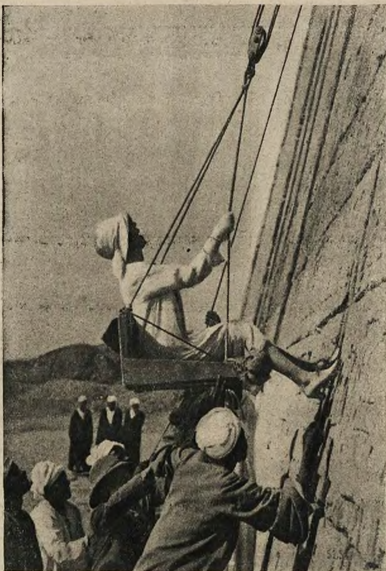
Królowa belgijska zwiedzała niedawno Egipt, a chcąc oglądać napisy kazała się wywindować na szczyt światni