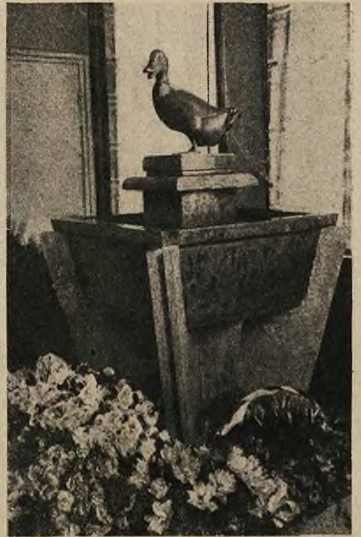
W berlińskim „Domu prasy“ ustawiono dowcipną rzeźbę wyobrażającą „kaczkę dziennikarską“.