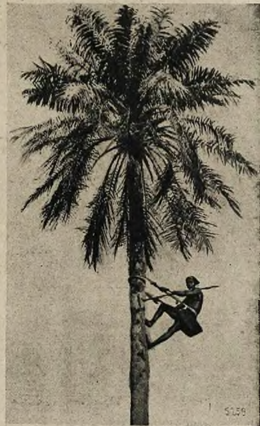
Murzyni wspinają się z łatwością na palmy kokosowe, wysokości 40 do 50 metrów przy pomocy pasów skórzanych, którymi przytwierdzają się do pnia palmy i posuwają się w ten sposób w górę.