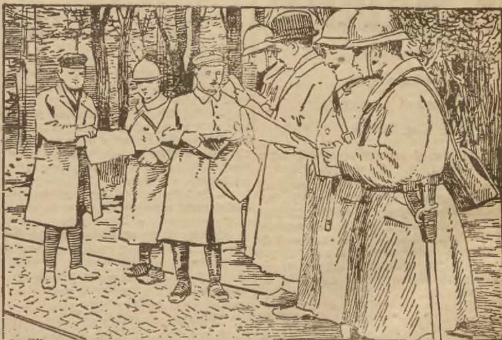
Kolporterzy francuscy sprzedają gazety paryskie żołnierzom francuskim zakwaterowanym w małym miasteczku w Zagłębiu Ruhry.