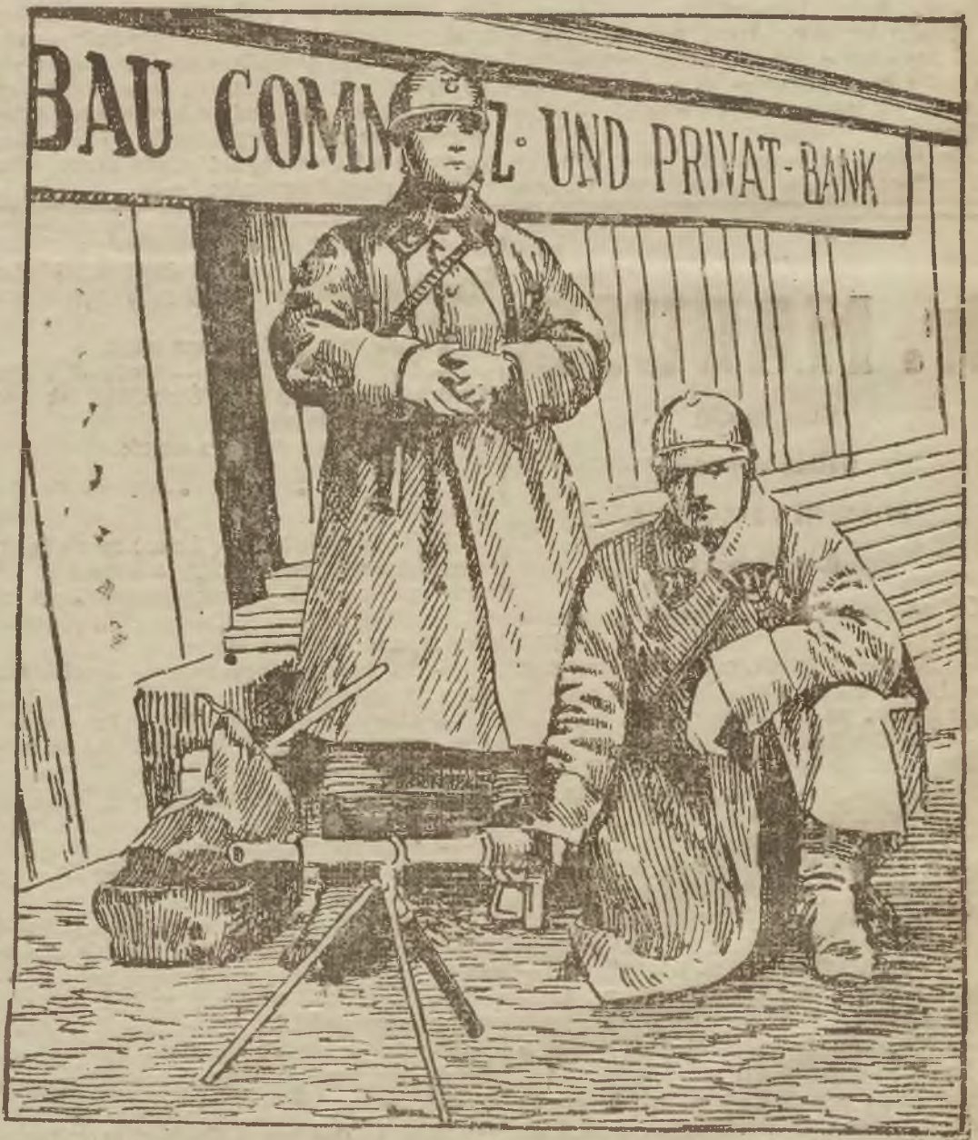
Francuski karabin maszynowy na ulicach miasta Essen.