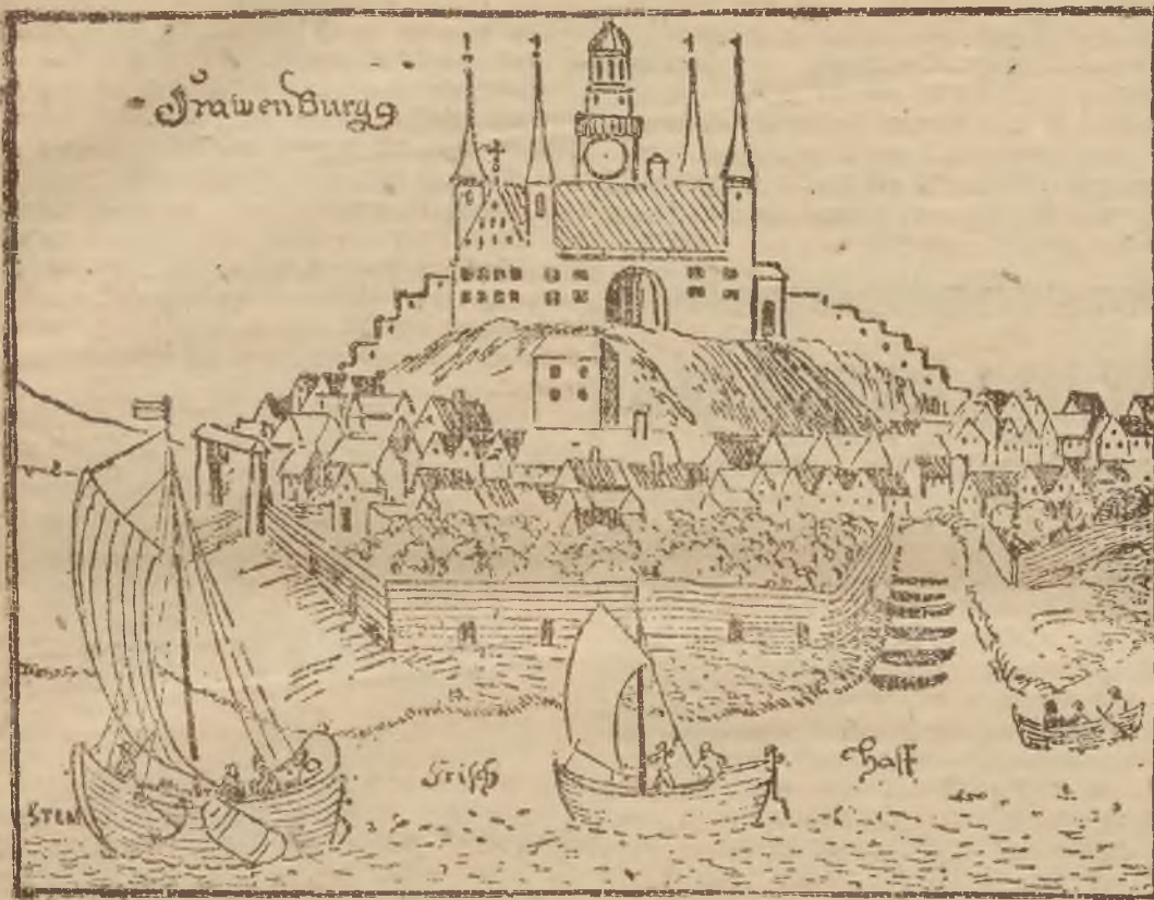
Miasto Fromberg, w którym Kopernik piastował urząd kanonika przy tamtejszej kapitule od r. 1512. Fromberg zawdzięcza Kopernikowi wodociąg i.

Sluchajcie tam miłego tego dziecka telnienia, To znówu mówcie z Matką, patrzcie na Jej [lica. Tem dzieciatk'iem to Jezus, hasło wybawienia, A tą Matką Maryja, przeczysta Dziewica.