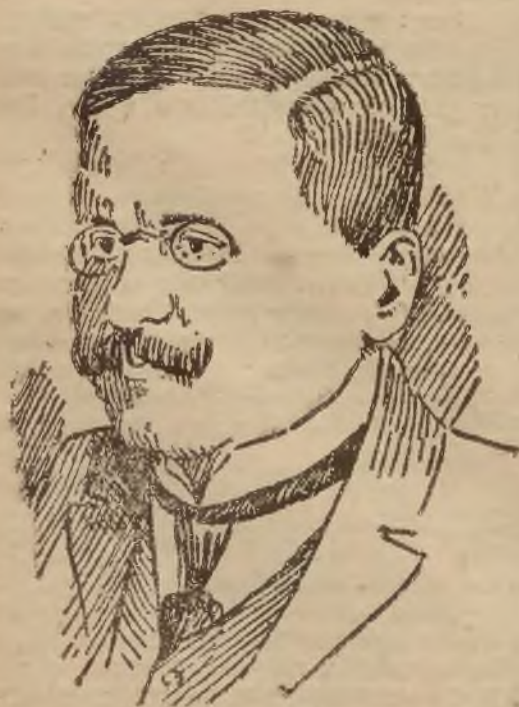
PROKURATOR RADCA DURJET

Dittner: Więc to, co ja w zausaniu i przyjaźni opowiadałam, pan traktował ja-