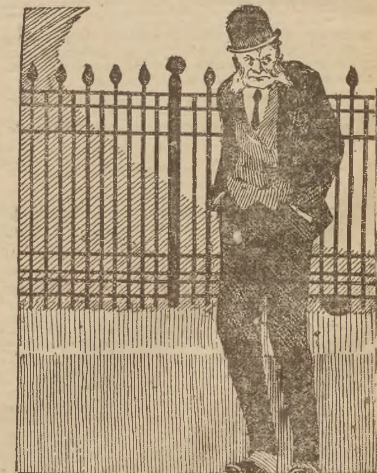
Pisarza... zgarbił się... (str. 175).