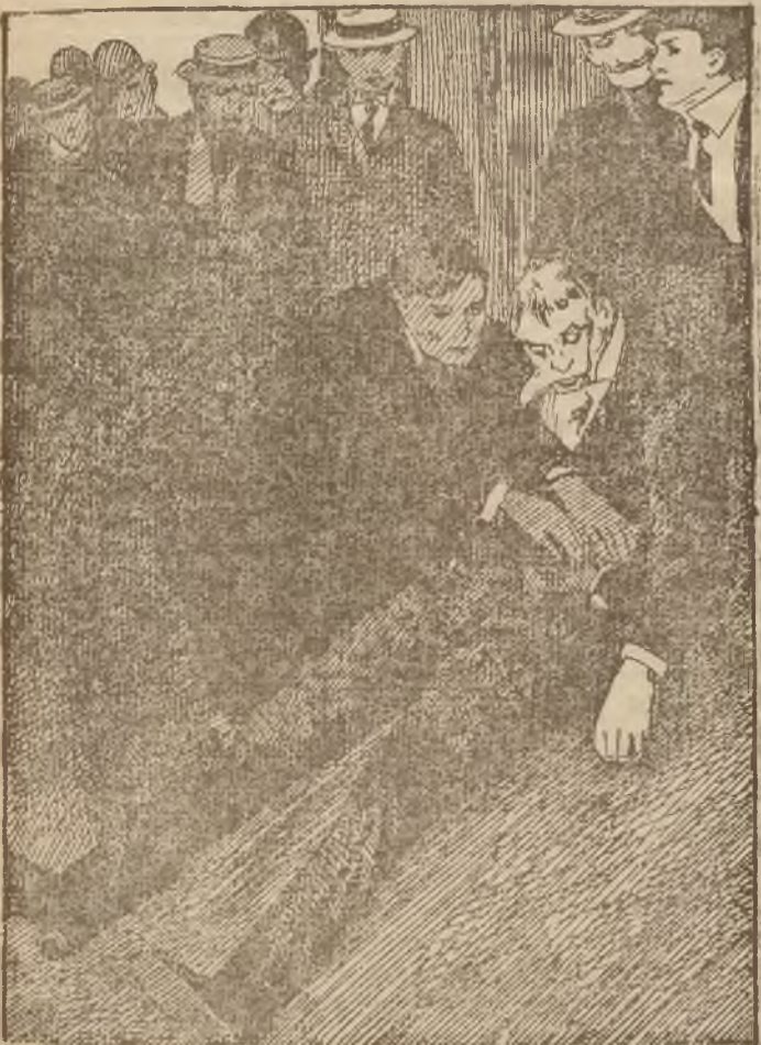
Śmierć Massagnaca (str. 171).