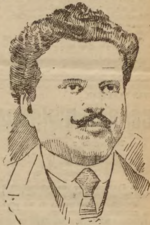
Prez. min. bułg. Stambolijski