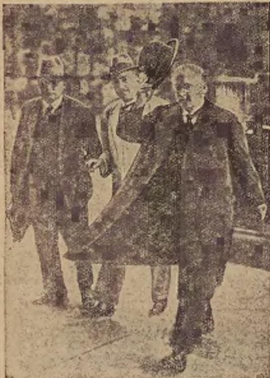
(xy) Kanclerz Rzeszy niemieckiej Brüning (nasza rycina) zdąży na rozstrzygające posiedzenie Reichstagu.