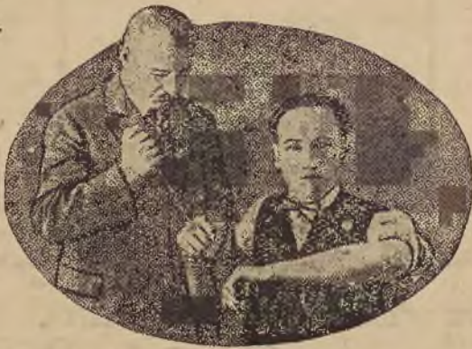
Ryc. II. Europejski fakir pozwala przebić swe przedramiona długimi igłami, nie doznając bólu i tamując upływ krwi.

Niebrak też fakirów, którzy sztuki swoje przeprowadzali na oczach i pod kontrolą lekarzy, a więc ludzi trzeźwych, którzy skrupulatnie badali warunki eksperymentu. Przed taką komisją popisował się fakir Tahra Bey, który kładł się nago na łożo całe najeżone ostreimi gwoździemi. Pomocnik jego stawał mu na piersiach, aby nacisk wywarto przez