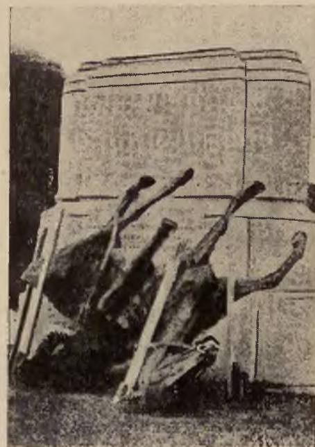
W Waszyngtonie runął niespodziewanie z piedestału konny posąg gener. Nataniela Greene.