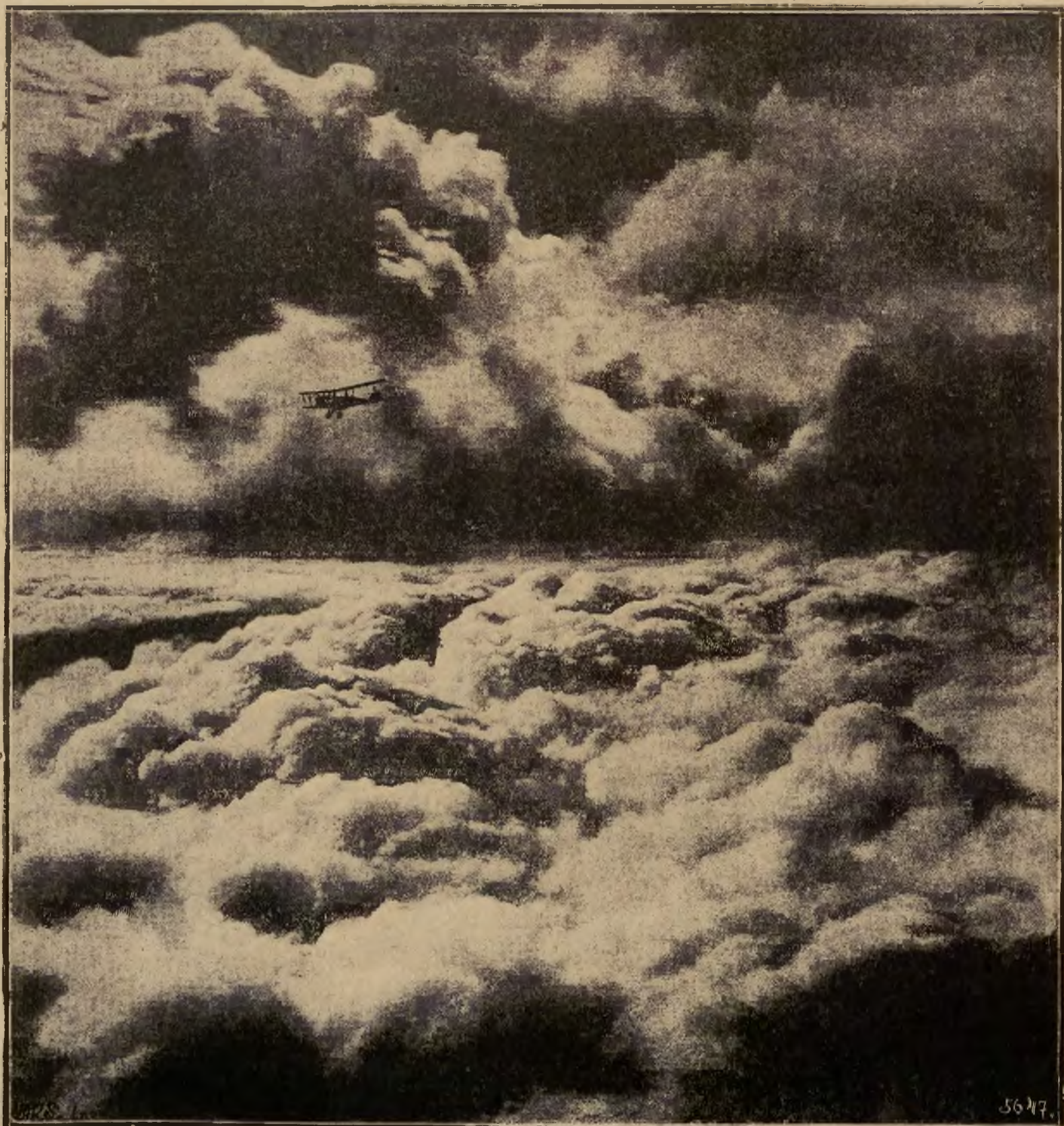
Między niebem a chmurami. Samolot szybujący nad olbrzymim morzem chmur.