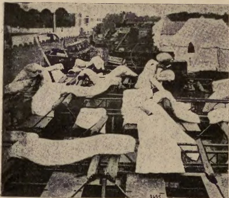
W czasie wyścigów konnych w Ascot widzowie nocowali na trybunach, aby mieć następnego dnia dobry widok.