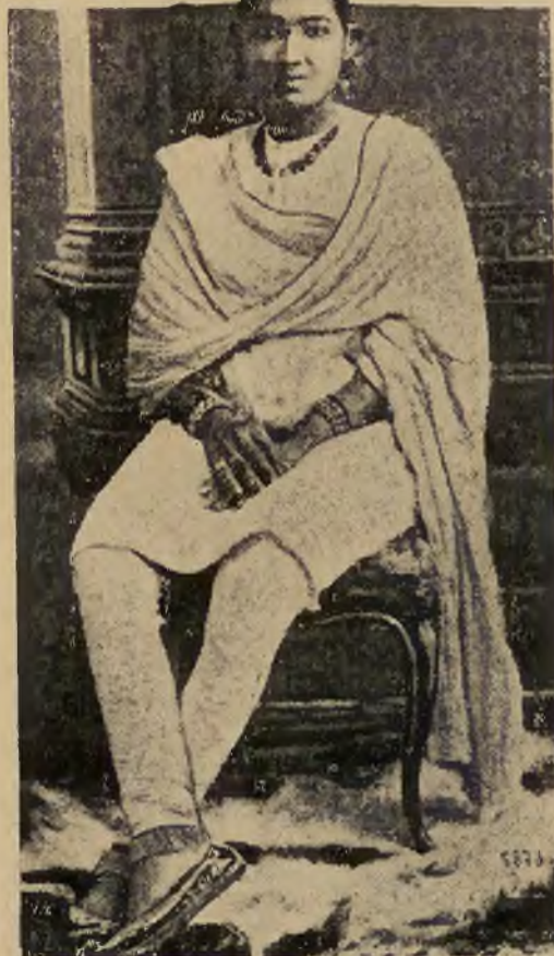
Z kraju Gandhiego: Hinduska z stanu mieszczań- skiego. — Rycina obok. Młoda Hinduska z ary- stokracji w kosztownym stroju z Delhi.