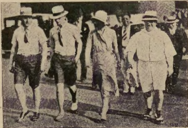
Nowa letnia moda męska w Nowym Jorku ma już swoich zwolenników.