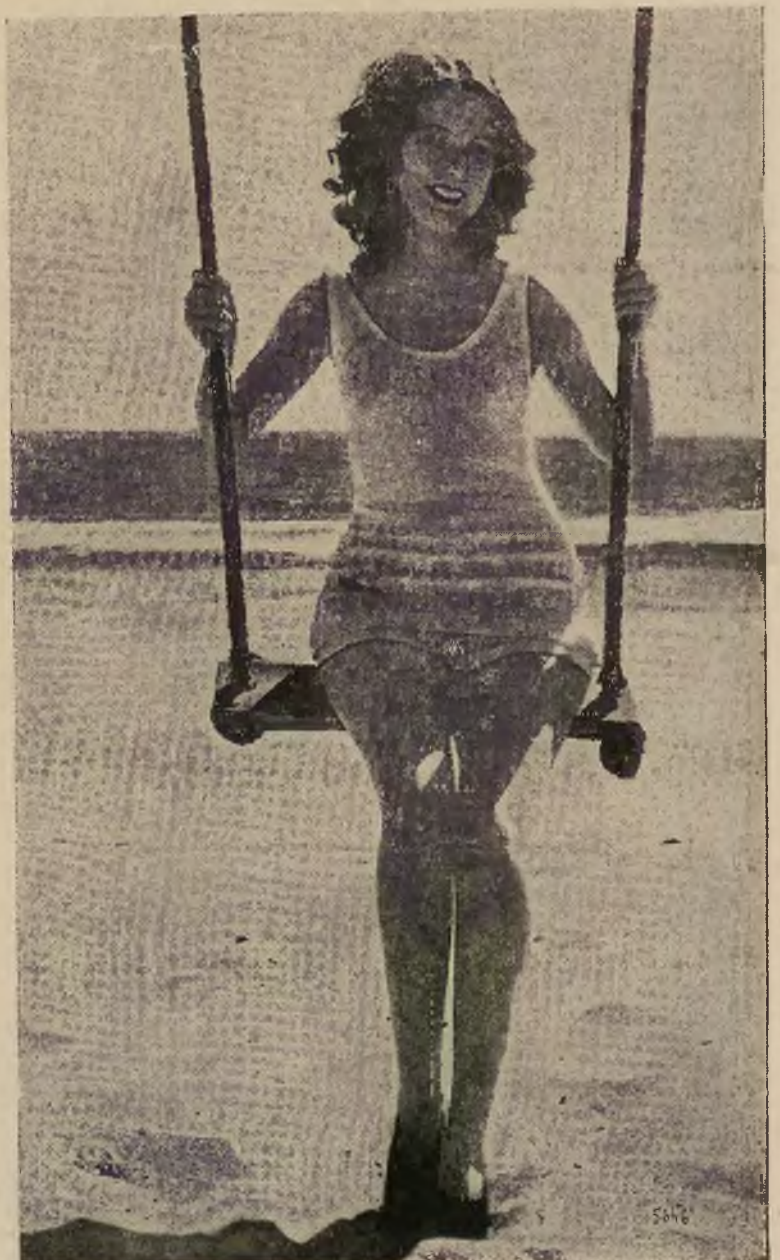
Rozkosze kąpieli morskiej: po kąpieli huśtawka na plaży.