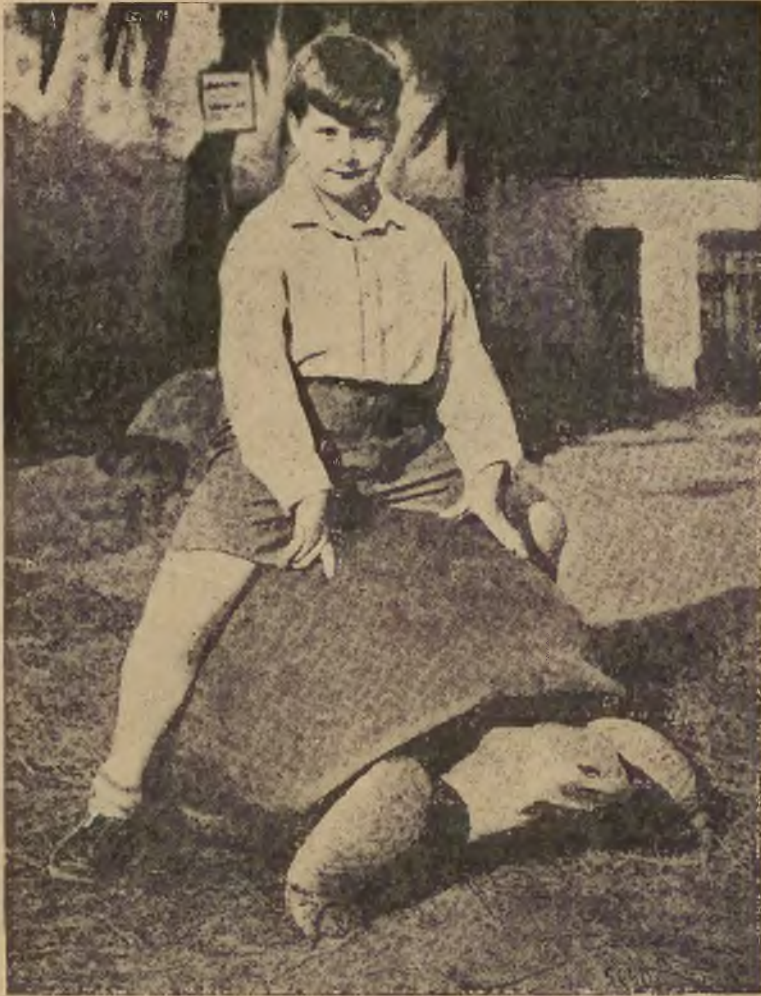
Najstarszemi zwierzętami są żółwie. Żyją one ponad 200 lat.