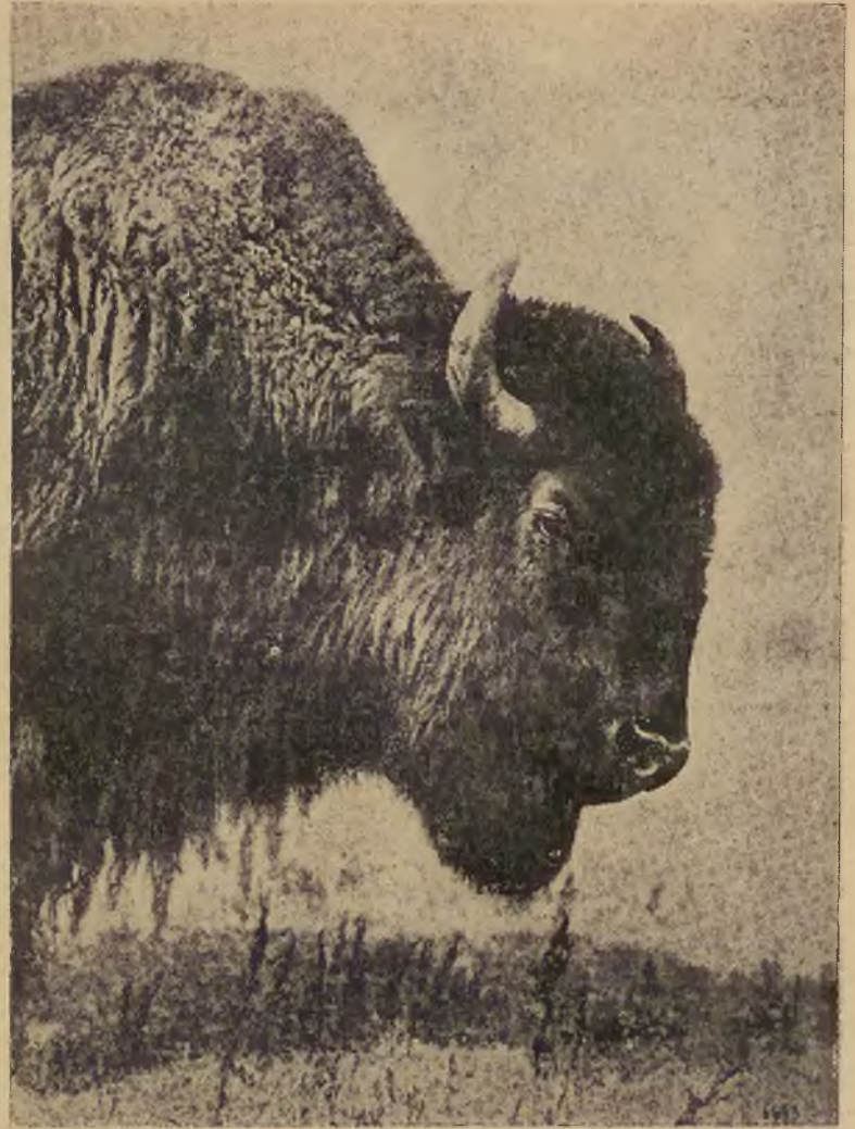
Zdetronizowany król Prerji: amerykański bizun.