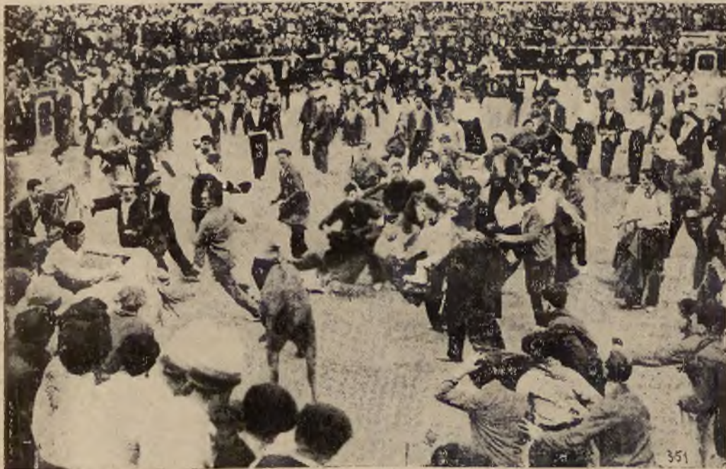
W małym hiszpańskim miasteczku Pamplona istnieje zwyczaj, że przed rozpoczęciem walki byków publiczność pędzi zwierzęta przez miasto aż do samej areny.