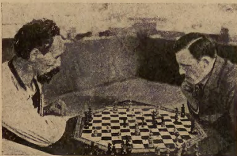
W Monachjum wystawiono na pokaz nowe szachy. Posiadają one 16 skoczków (8 czarnych i 8 białych). Szachy mają 48 figur i 120 pól.