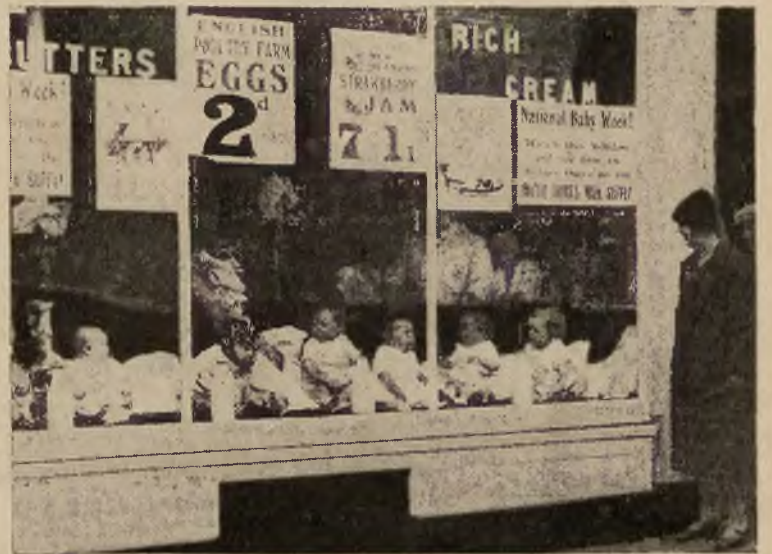
W Londynie odbył się „tydzień niemowląt“. żywe niemowlęta wy- stawiono w oknie dla reklamy.