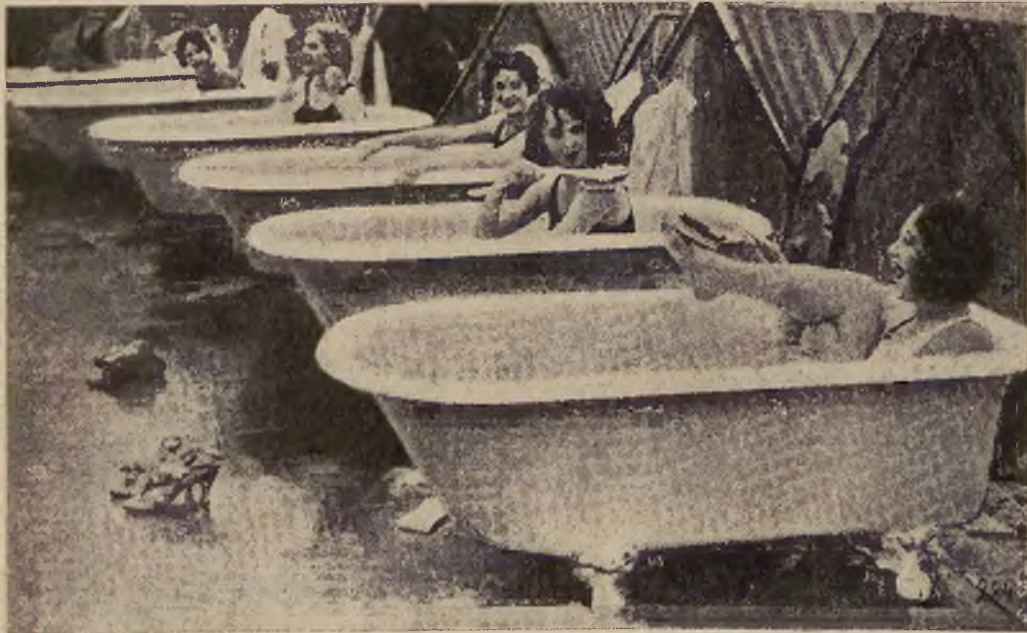
Amerykańskie rekordy. Zawody w najszybszej kąpieli w wannie.