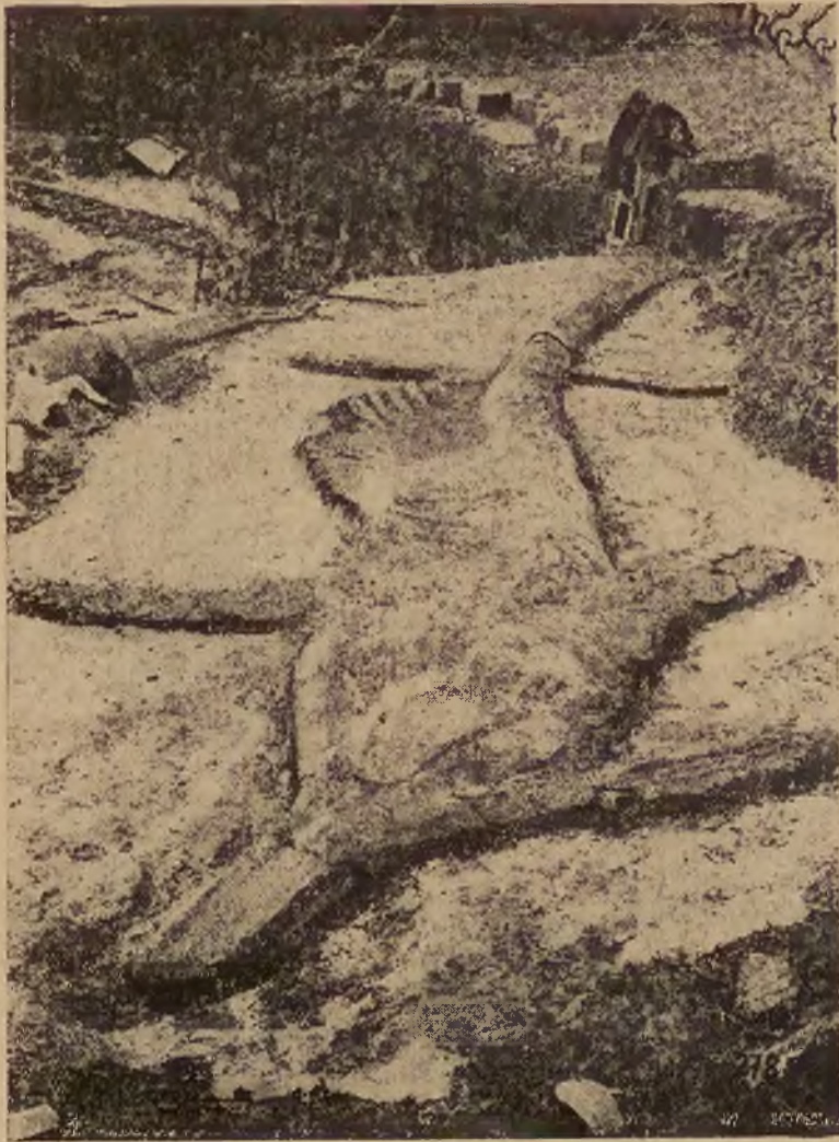
W Angji znaleziono szkielet przedpotopowego zwierzęcia, plesiosaury, który posiadał prawdopodobnie troje oczu