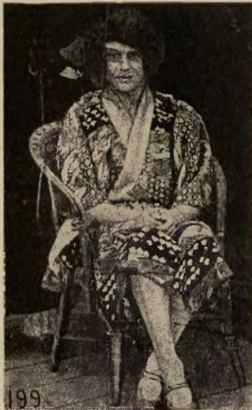
Książę Walji na zabawie przebrany za kobietę.