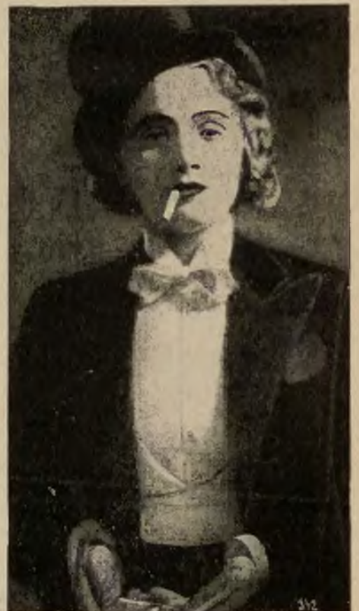
Artystka filmowa Marlena Dietrich gra w no- wym filmie dźwiękowym Parada „Paramountu“