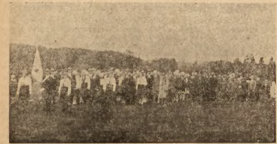
Spójnia Młodzieży R. O. K. w Uzdryholowiczach w strojach korporacyjnych ze sztandarem udaje się do kościoła.

O godzinie 9 rano, Spójnia Młodzieży R. O. K. w strojach korporacyjnych jak również