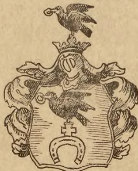
Herb rodzinny Pana Prezydenta Rzeczypospolitej Ślepowron

Po zakończeniu ceremonji powitania ruszono w kierunku Wilna.