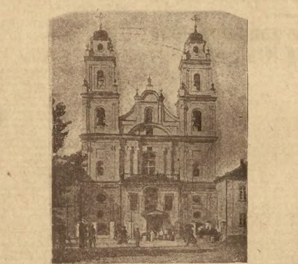
Kościół katedralny w Mińsku.