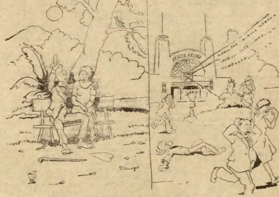
Dawniej w Bernardynce słuchało się psatząt. Obecnie radio czyni nieznosny hałas.

— Przedstawienie popularne w „Lutni”. Teatr miejski w „Lutni” rozpoczyna niebiażem cykl popularnych przedstawień po ce-