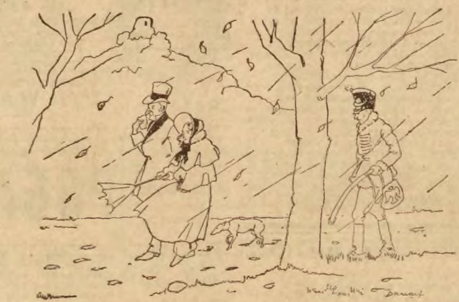
Wczoraj nad ranem spadł w Wilnie pierwszy śnieg, spowodowany przedwczesnym chłodami. Śnieg rychło stał się prozostawiając żadnych śladów.