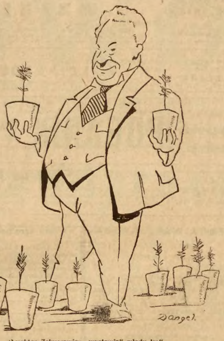
dyktor Zelwerowicz „wystawia” młody las.