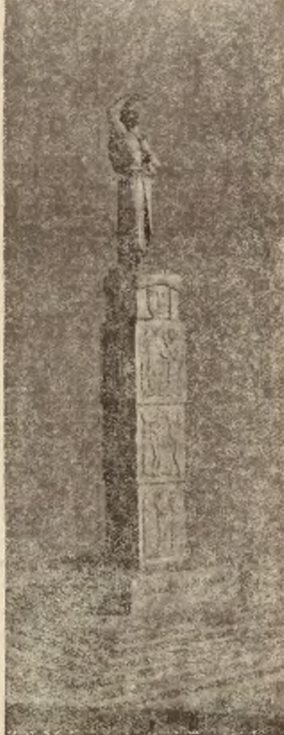
Projekt Henryka Kuny.