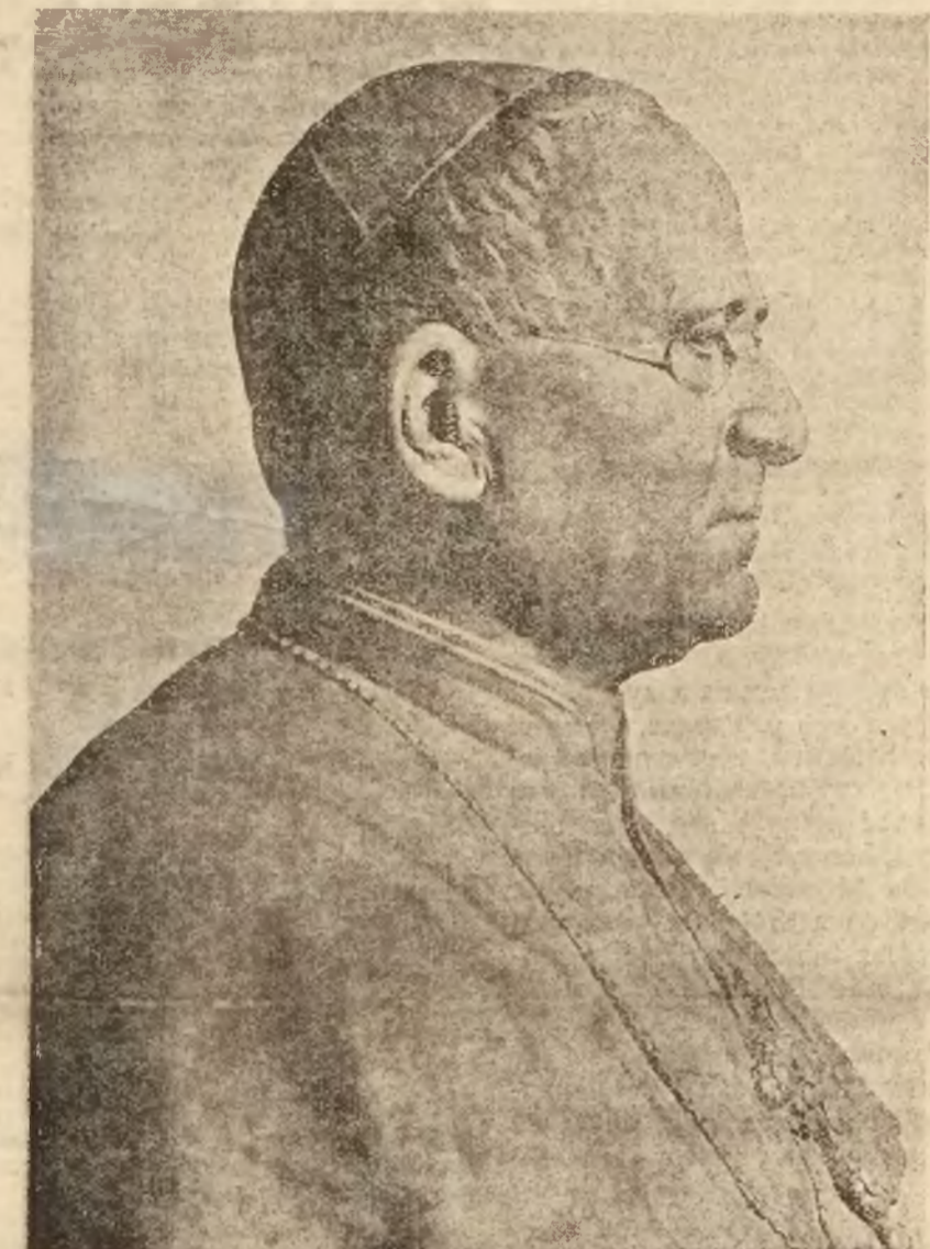
Barbarją wschodnią w r. 1920, — jest bliska każdemu Polakowi.