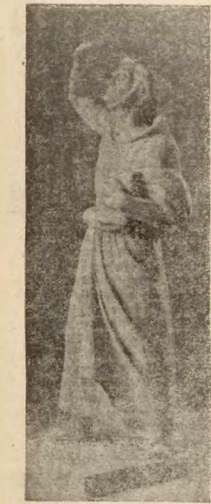
Postać Mickiewicza według projektu Henryka Kuny.

Złóż grosz na „Fundusz Polskiego Szkolnictwa zagranicą”, na konto P. K. O. 21895, Komitetu Obchodu 25-lecia Walki o Szkołę Polską.