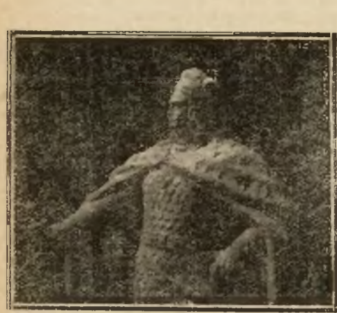
Model p. Jachimowicza.