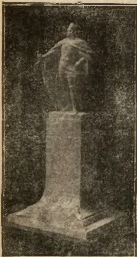
Model p. Jachimowicza.