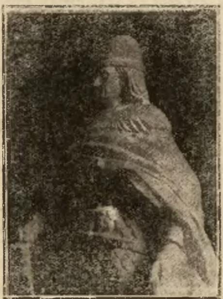
Model prof. Śleńdzińskiego.