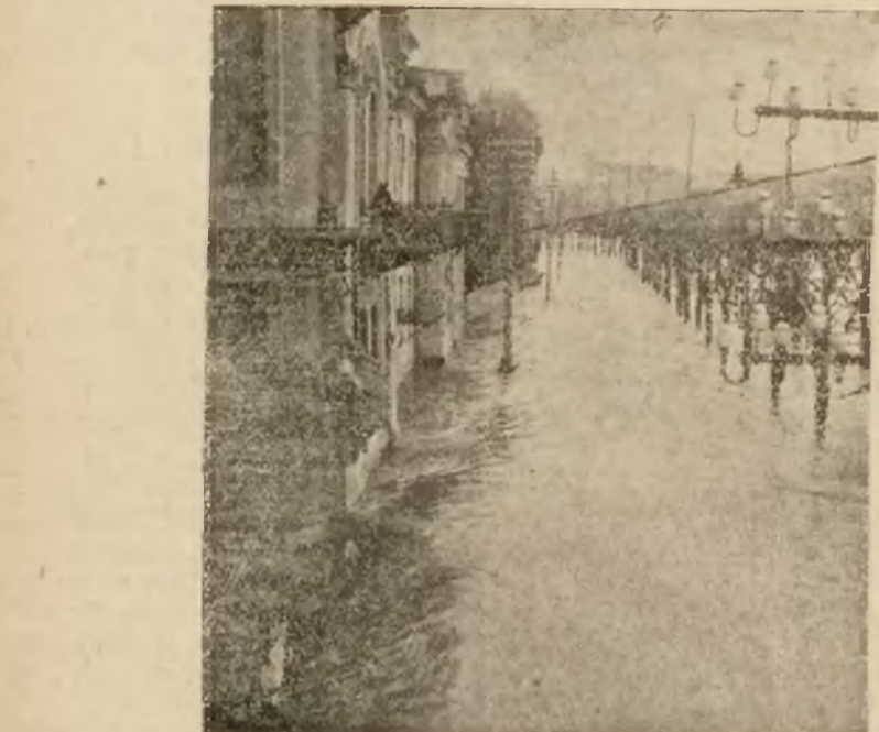
Tak wyglądała ul. Zygmuntowska w dniu 24 kwietnia 1931 r.