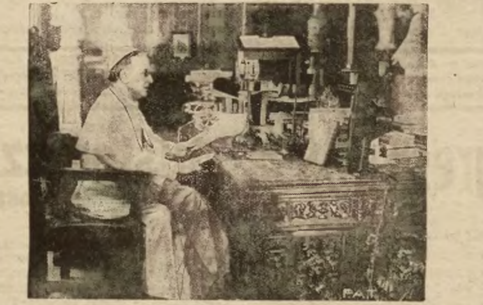
Ojciec św. Pius XI przemawia do mikrofonu Radjostacji Watykańskiej z swego gabinetu.

na ulicę Piusa XI. Będzie to znakomitą uświetnieniem w pamięci potomności wielkiego Przyjaciela i Ojca wskrzeszonej Polski, jakim jest Jego Świątobliwość Ojciec św. Pius XI. Poczytywałem sobie za obowiązek