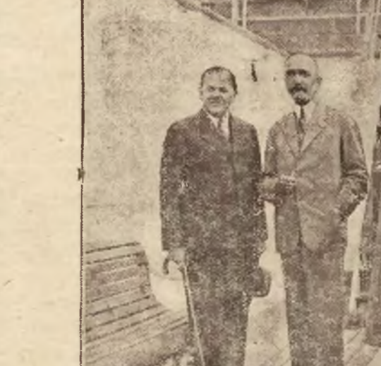
Niebawem powiędzenie cieszą się w tym roku wycieczkowe podróże okrętami Polskiego Towarzystwa Transatlantyckiego. Okręt „Polonia”, który wyruszył do fiordów norweskich liczy między swymi pasażerami szereg znanych osobistości ze świata politycznego, naukowego i artystycznego.