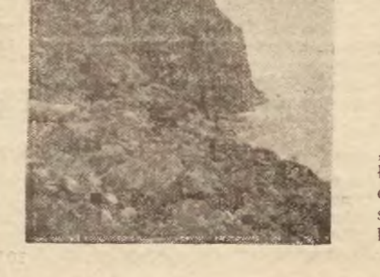
Niebawem powiędzenie cieszą się w tym roku wycieczkowe podróże okrętami Polskiego Towarzystwa Transatlantyckiego. Okręt „Polonia”, który wyruszył do fiordów norweskich liczy między swymi pasażerami szereg znanych osobistości ze świata politycznego, naukowego i artystycznego.