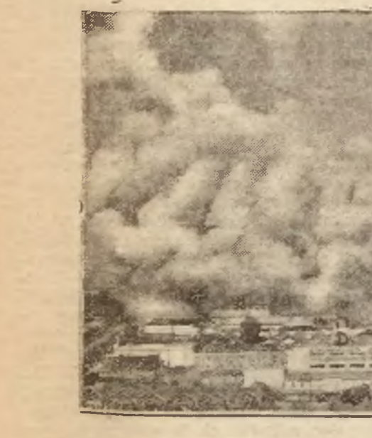
Pożar największego parku rozrywkowego

Opublikowane zostało urzędowo rozporządzenie ministra wyznań religijnych i oświecenia publicznego w sprawie ustanowienia okręgów szkolnych dla celów administracyjnych w zakresie wychowania.