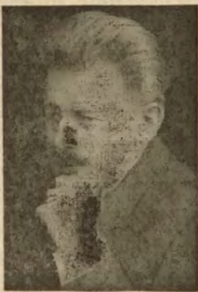
Czesław Jankowski w r. 1900.

smacznego banału, przetrwałonego szablonu i „lakmanad”. Tak, tylko od takiego filmu polskiego z „kresowym” dworem i ułanami dzieliła nas jedna rzecz, która właśnie w dziedzinie sztuki jest rzeczą wielką, to jest autentyczność. Grupa polityczna „Słowa”, to autentyczni ziemianie i autentyczni kawalerzy-