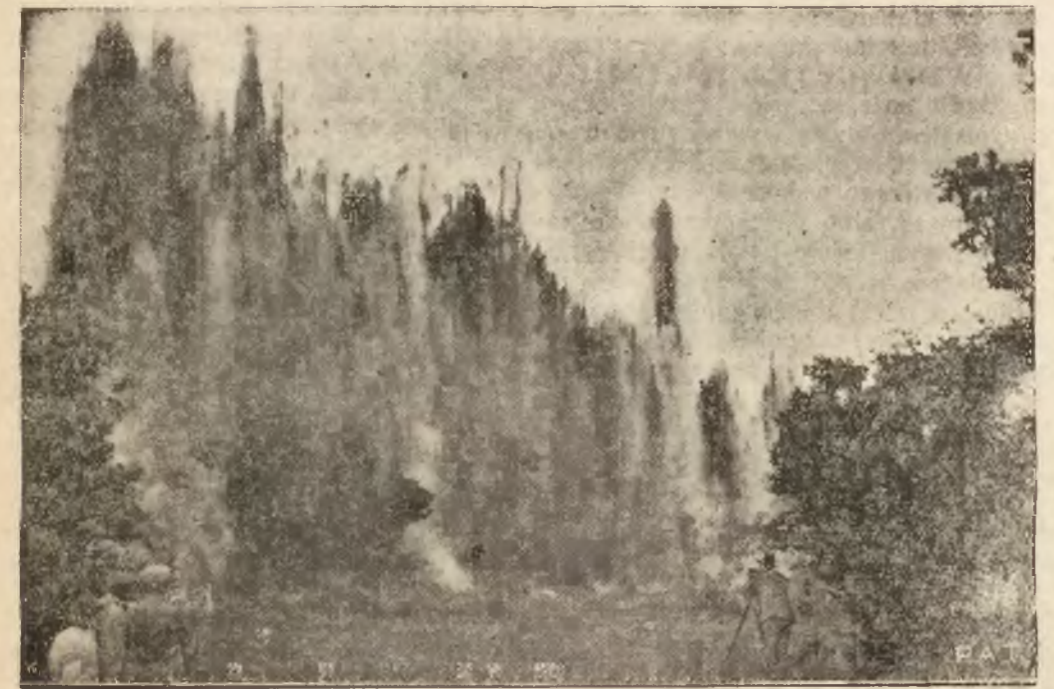
Przed kilku dniami użyto po raz pierwszy w Polsce dynamitu do prac melioracyjnych, mianowicie w celu wyrównania bardzo krętego biegu rzeki Orzuc pod Drodźdowem na Polesiu, połączone dwa węzły rzeki linją nabojów dynamitowych, których wybuch utworzył nowe, głębiej i równe koryto rzeki.

Ilustracja nasza przedstawia groźny widok wybuchu pół-tonowego ładunku dynamitu. Praca ta wykonana została przez Państwową Wytwórnę Prochu pod kierunkiem inż. Raczynskiego.