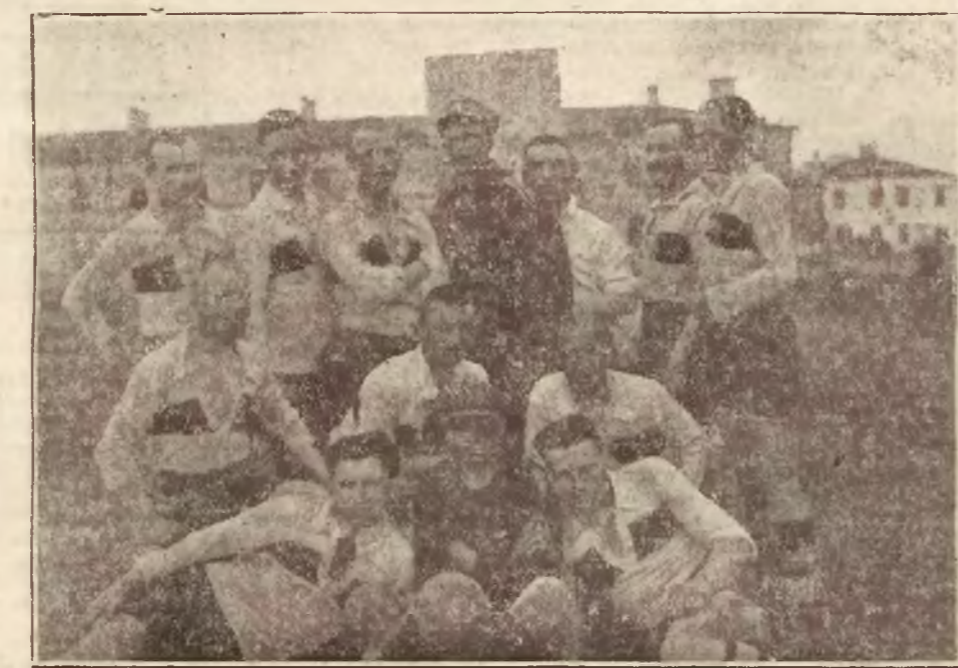
Drużyna piłkarska 6 p.p. Leg. zaprezentowała się wczoraj z jak najlepszej strony, walcząc ambitnie, w wyniku czego zdobyła jeden punkt na mistrza okręgu — 1 p. p. Leg.

Ostatecznie przychodzi wyrównanie zdobyte przez samobójczego i wślaz za tem ostro gra. Los 1 pułku wisi na włosku kiedy sędzia odgizduje faul na polu karnej.