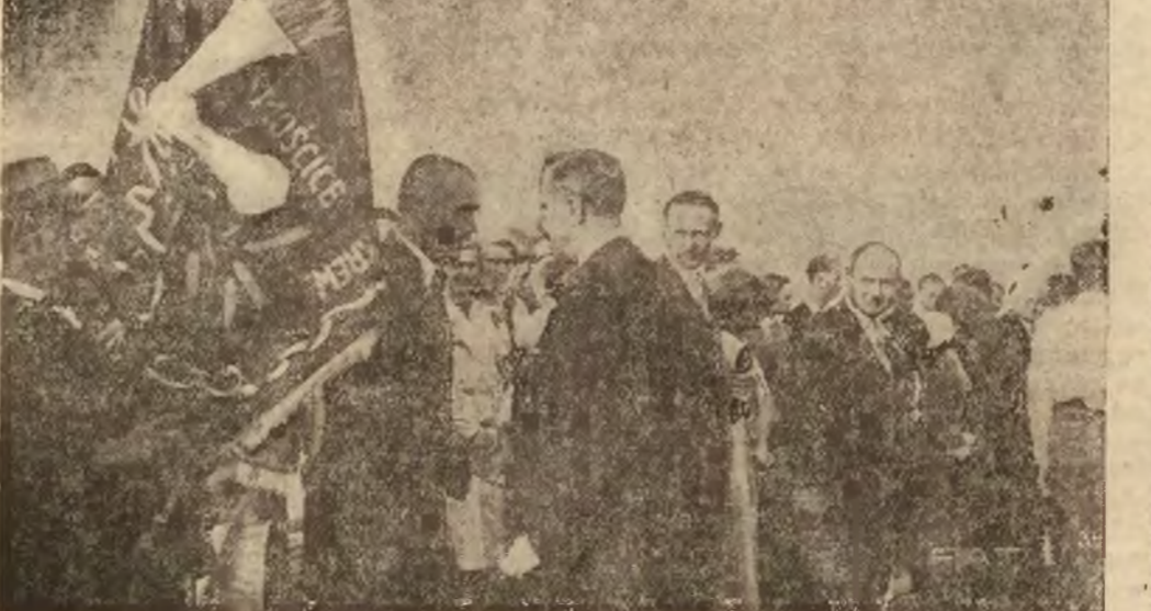
Wśród wycieczek przybyłych ze wszystkich zakątków Polski na Święto Morza w Gdyni znajdowali się również przedstawiciele robotników Państwowej Fabryki Azotowych w Mościcach. Na fotografii naszej widzimy p. mini-

stra Kwiatkowskiego jednego z najbardziej zasłużonych twórców Gdyni, a obecnego dyrektora fabryki mościckiej w rozmowie z przewodniczącym delegacji robotników z Mościc.