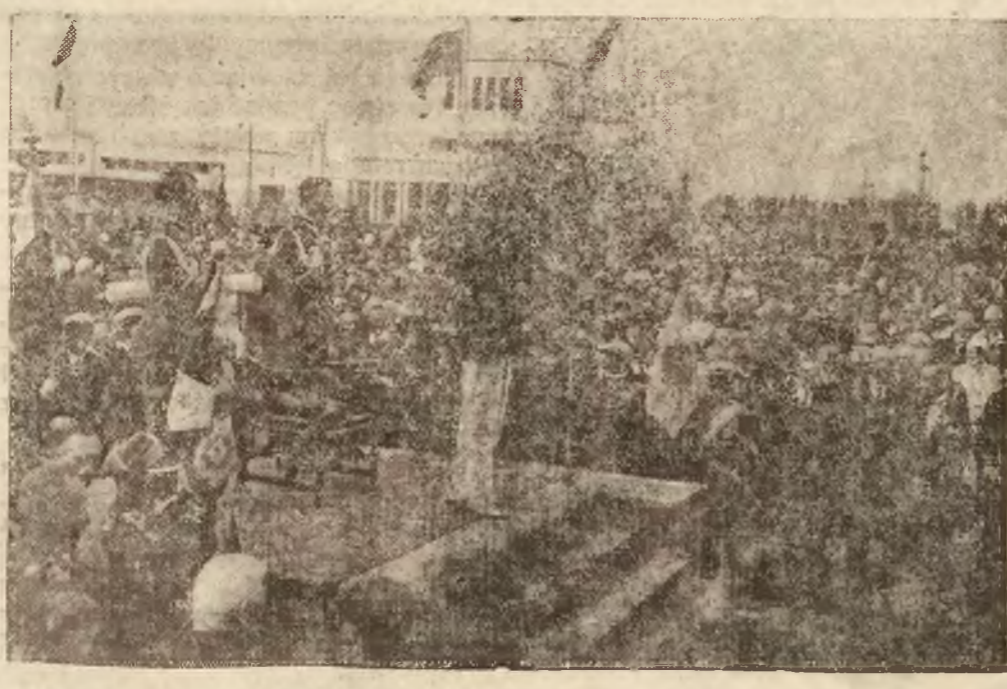
Imponującą manifestacją łączności całej Polski z morzem i Pomorzem było obchodzone w dniu 31-ym lipca Święto Morza. 100.000 osób ze wszystkich stron kraju przybyło na ten dzień do Gdyni. Na zdjęciu naszym widzimy Pana Pre-