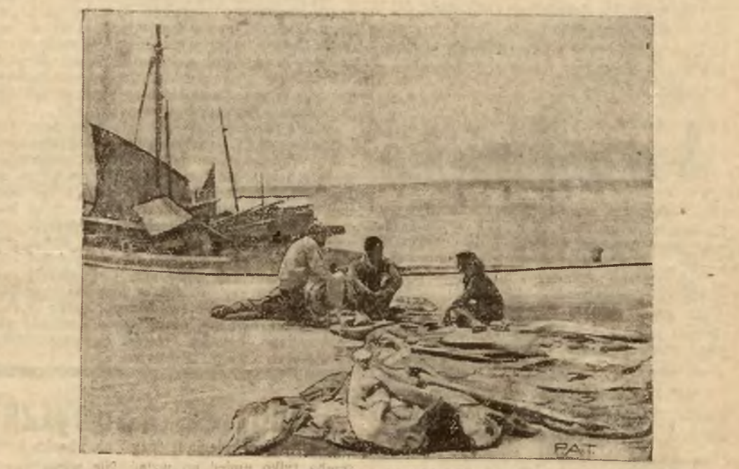
Jugosławia posiada niezliczone zacisne plaże morskie, na których spędzają lato mieszkańcy wielkich miast, odpoczywając po zgiele...