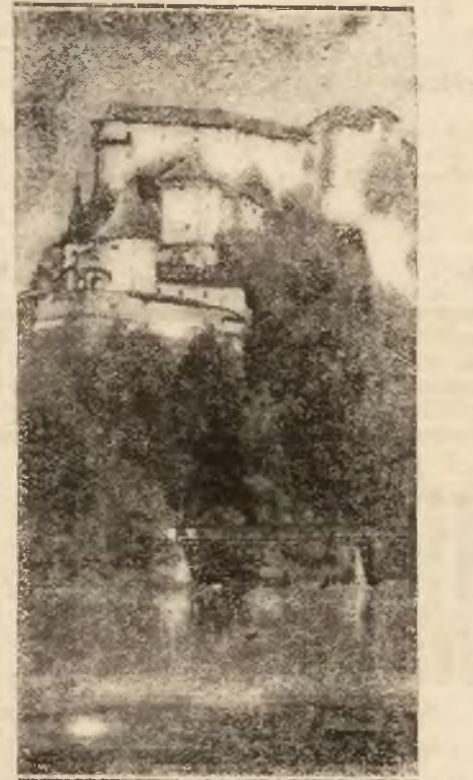
Groźnie wznosi się na skale zamek orawski, dawne miejsce więzienia i kaźni zbrojników tatarskich. Jest to najpiękniejszy zamek po czeskiej stronie Tatr.

Wieś jest ładna — prawda? Widzieliście tam dużo ciekawych rzeczy. Z podwójną paścią rzućcie się więc w ciepło pniającego miasta. Ono was ponownie nasyci pięknem celowości, dyscypliną, porządkiem. Ono was natch-