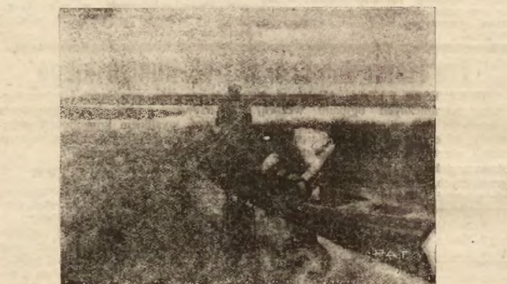
Myśliwi polescy chętnie polują na kaczki na wala. W tym celu zostawia strzelec na wodzie przywiązana kaczka, tak zwana krekucha, sam zaś ukrywa się w czolnie w szuwarach i czeka na zwabione głosem krekuchy kaczory. Ilustracja nasze przedstawia myśliwych z krekuchą.