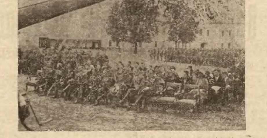
Ilustracja nasza przedstawia moment nasy polowej.

Te nagie postacie o zbyt wielkich głowach, za czarnych rękach i nogach za krótkich, o wytłaczanych, sztywnych ruchach, o kolorycie trupim — są jakby odrażające... Ale im dłużej się patrzy, tem wyraźniej wychyla się z ram obrazu i styczny, niesamowity czar Sredniowiecza i sprawia, że w tych postaciach po ciepłociw i zbawionych, świętych Pańskich, zielonoskrzydłych diabłów i aniołów, widzi się o wiele więcej, niż jest namalowane. A na tem właśnie polega piękno średniowiecznej sztuki religijnej.