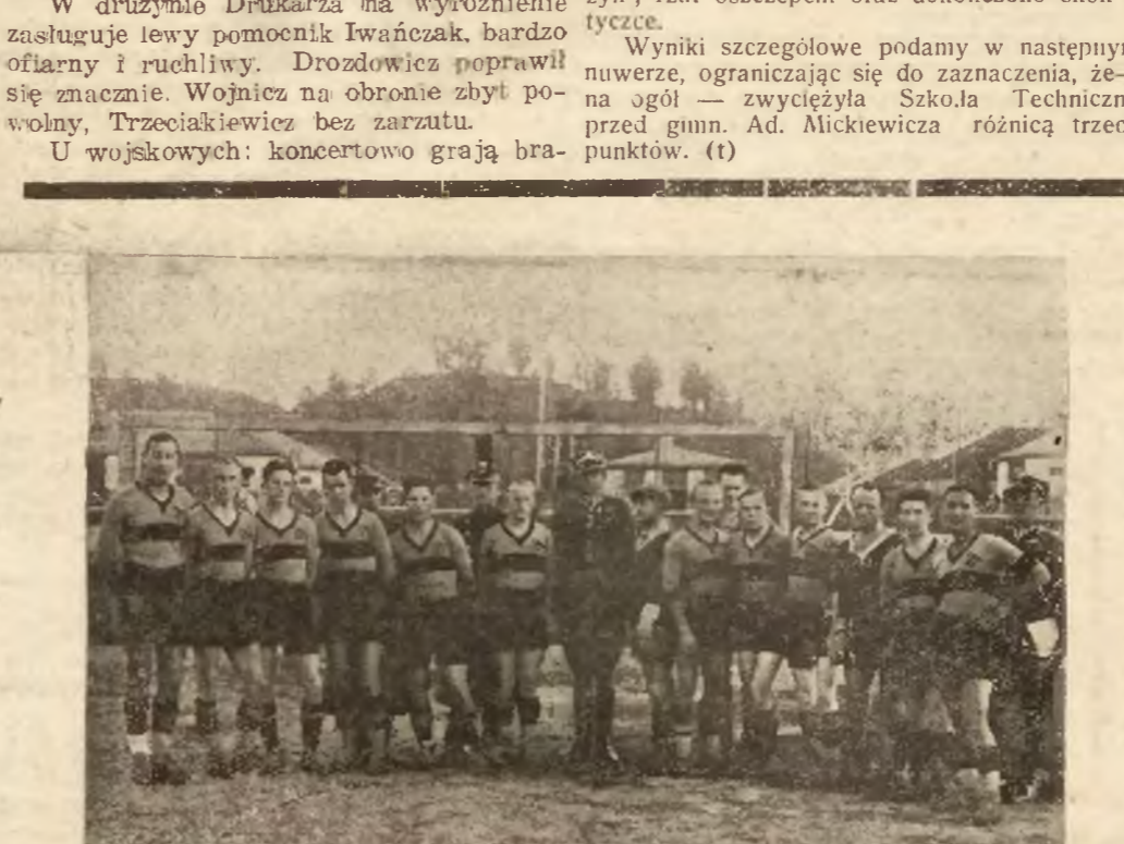
Mistrz grupy półn.-wschodniej, drużyna I p.p. Leg. walcząco o wejście do Ligi grająca mecz z mistrzem grupy zachodniej, drużyna „Legia” — Poznań.

Wyniki szczegółowe podamy w następnym numerze, ograniczając się do zaznaczenia, że — na ogół — zwyciężyła Szkoła Techniczna przed gimn. Ad. Mickiewicza różnicą trzech punktów. (t)