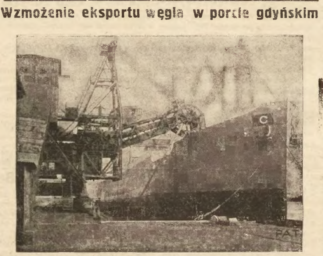
Ekspert węgla przez Gdynię wzrósł znacząco w ciągu ostatniego miesiąca dorównując eksportowi przez port gdański. Zauważać to należy nowoczesnym urządzeniem przeladunkowym portu gdyńskiego. Na ilustracji naszej widzimy ładownicę węgla z załadunkiem do Argentyny „taśmowcem” Skarbobolpu.