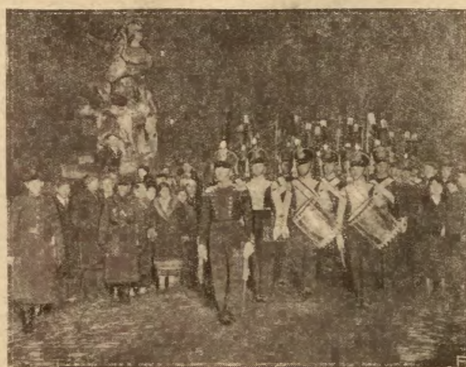
W rocznicę czynu Piotra Wysockiego

Podkomitet dla sprawy prywatnej fabrykacji broni rozpoczął dziś swe prace pod przewodnictwem delegata polskiego Komarnickiego.