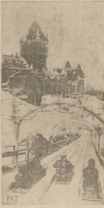
Idealnym miastem dla sportów zimowych jest Quebec w Kanadzie. W Warszawie zbudowany jest idealny tor dla jazdy na t. zw. „toboggan”, specjalnym rodzaju saneczek, służących się na całej swej spodniej powierzchni.