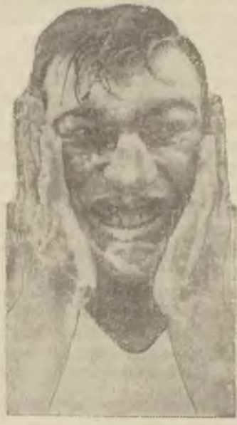
Namydlony Carnera, mistrz świata wagi ciężkiej w boksie, przygotowuje się plnie do walki o utrzymanie swego tytułu.