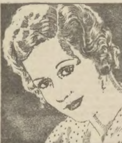
Maszynistka opowiada Historję Swego Życia

Pani B...., poślubiła niedawno syna szlache bogatego przemysłowca. Na wywiadzie, jaki z nią uczyniono, powiedziała: „Pyta Pan dlaczego mój wybrał mnie? Byłam maszynistką w biurze jego ojca. Nie mogłam sobie pozwolić na drogie suknie jak te wszystkie pauny, w towarzystwie których przebywał, ale zawsze poświęcałam największą uwagę mojemu. Mąż mój wyznał mi, że przedewszystkiem moja śliczna cera przyciągnęła jego uwagę. Używam zawsze Odżywczych Kremów Tokalon, białego na dzień, różowego zaś na noc. Rzeczywiście, zadziwiająca jest zmiana jaką kremy te czynią w wyglądzie każdej kobiety już po kilku dniach. Nigdy nie będę używać żadnych innych kremów”.