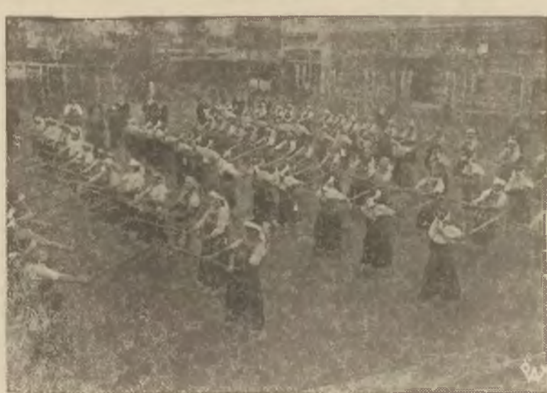
We wszystkich szkołach średnich japońskich wprowadzono jako jeden z punktów programu fizycznego szermierkę, przyczem zamiast szabli używa się kijów bambusowych. Na zdjęciu — uczenie szkoły w Tokio w czasie ćwiczeń szermierczych.