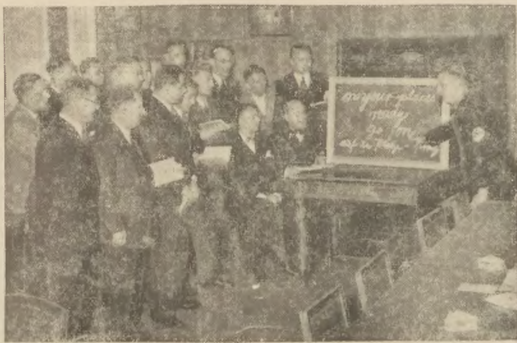
Kursy obcych języków dla przyszłych sędziów olimpijskich, urządzone w Niemczech. Na zdjęciu jedna z taktik lekcyj.