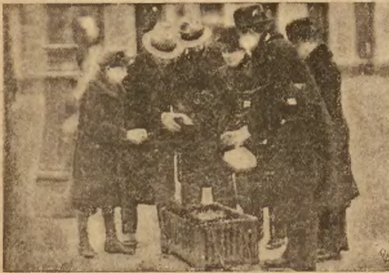
Zarząd m. St. Warszawy zainstalował na ulicach miasta na czas mrozów piec...