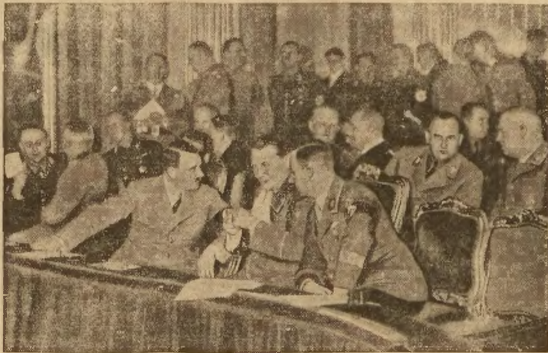
Najwierniejsi przedstawiciele dzisiejszych Niemiec złożyli Hitlerowi ślubowanie wierności w berlińskiej operze państwowej, gdzie wieczorem odbyło się przedstawienie. Na zdjęciu kanclerz Hitler z otoczeniem w łożu honorowej.

ników chwytając urywkami i od jednego i od drugich pewne zdobycze i cechy a występując namiętnie przeciw obydum.