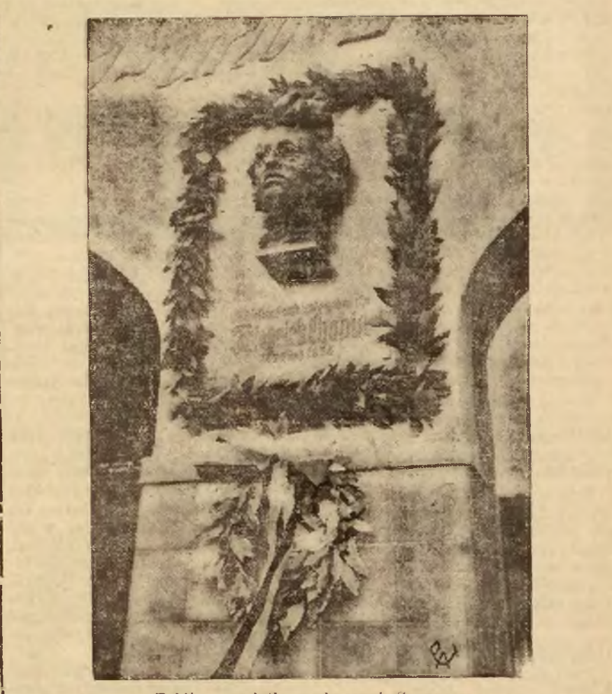
Tablica pamiątkowa ku czei Szopena.