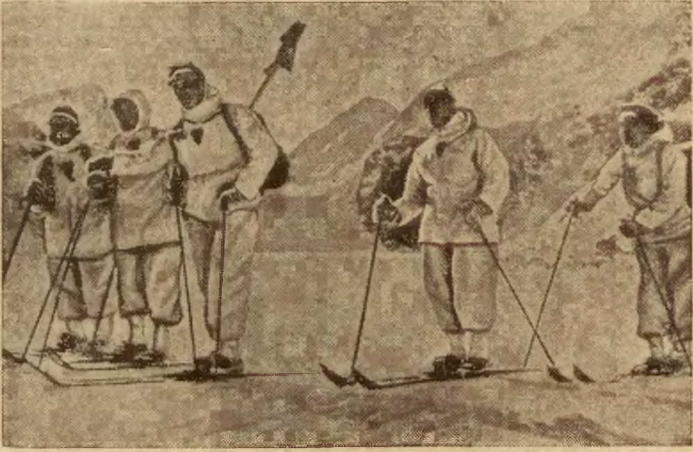
Towarzystwo filmowe, które robiło zdjęcia do filmu „Białe djabły” zostało zasypanne lawiną. Dwie osoby poniosły śmierć, w tym znany narciarz Fücher (ostatni na prawo).