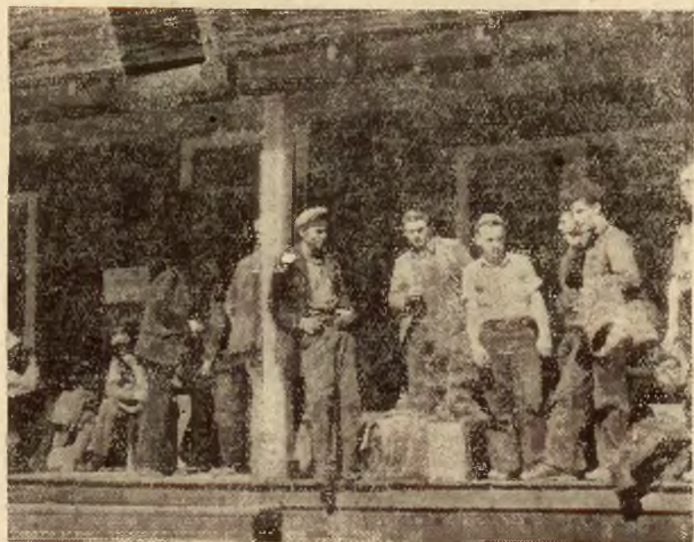
Wedle statystyki, wobec bezrobocia panującego w Ameryce stwierdzono, że w roku 1933, od 200 do 500.000 młodzieży w wieku od 14 do 20 lat włożyło się po Stanach Zjednoczonych bez zajęcia i celu. Na zdjęciu jedna z kwater tych włóczęgów, będących główną troską dzisiejszego rządu amerykańskiego.