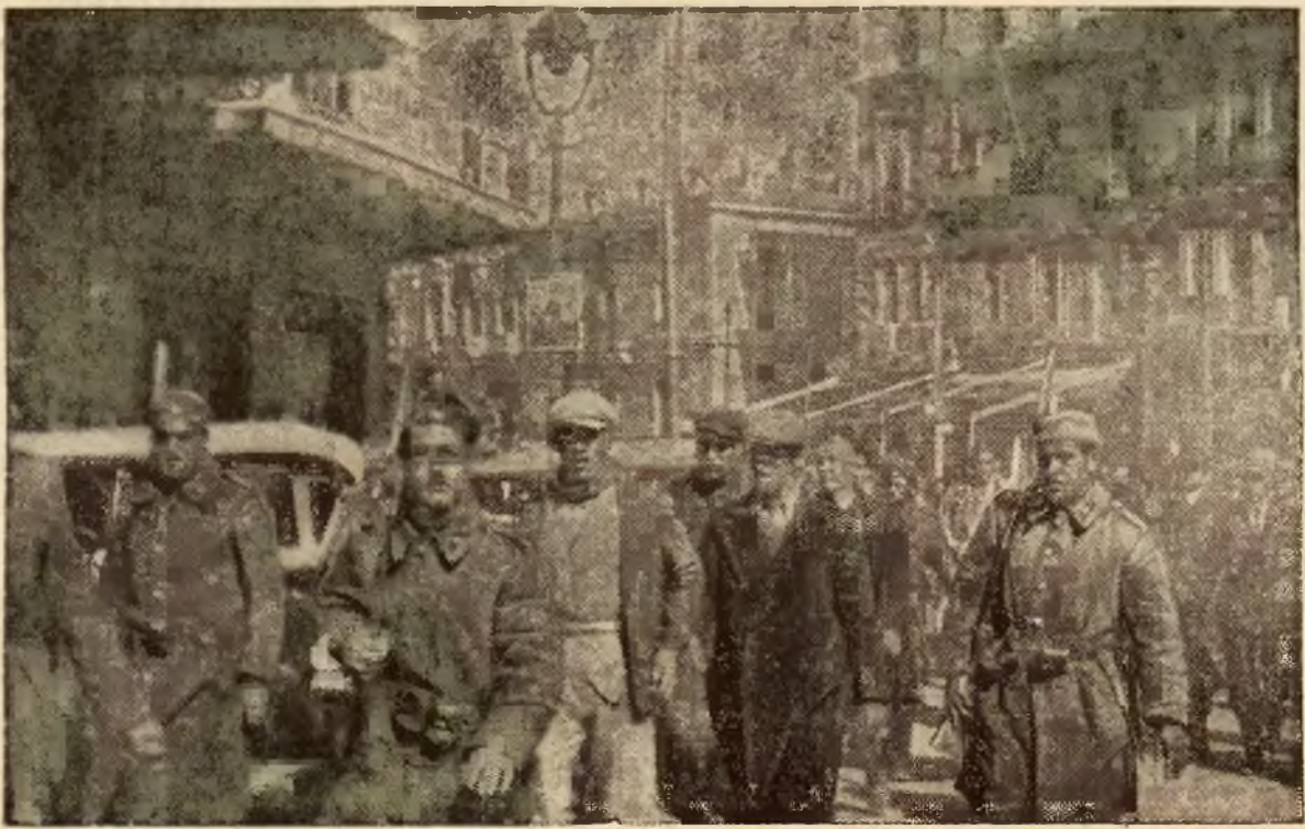
Pierwsze oryginalne zdjęcie z powstania w Grecji. Na lewo odprowadzenie schwytych jeńców pod silną eskortą. Na prawo żołnierz z oddziałów Evzów, jeliły wojska greckiego, które przeszły na stronę powstańców.