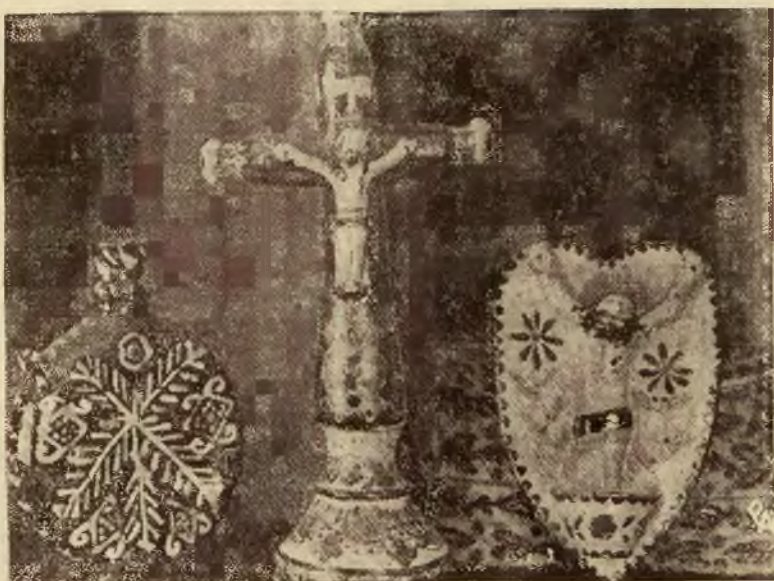
Piękne okazy huculskiego przemysłu ludowego: eutra — gliniana butelka do wody, krucyfiks i kropielnica z charakterystyczną ornamentyką.