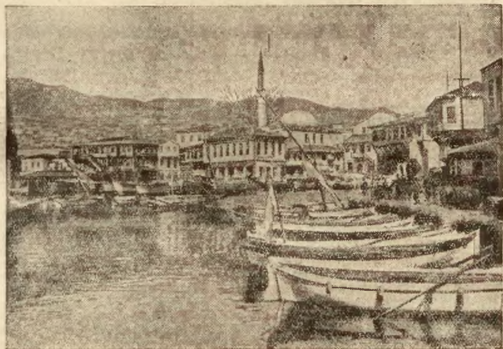
Kavalla — centrum ruchu powstańczego