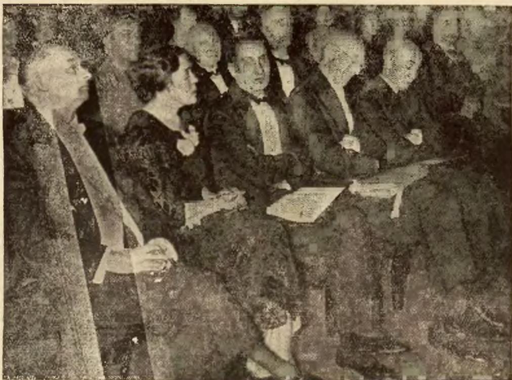
W Halle w Niemczech odbyły się uroczystości z okazji 250-lecia urodzin znakomitego muzyka Jerzego Fryderyka Haendla.