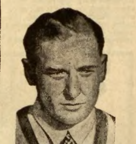
Bieg na 50 km. w Oslo wygrał Norweg Oskar Gjoeslin w 8 godz. 43 min. i 47 sek.

Dzisiaj i jutro odbędą się w Krakowie finałowe rozgrywki o mistrzostwo Polski w siatkówce męskiej. Do tych zawodów zgłosiło się 7 zespołów. Wal-