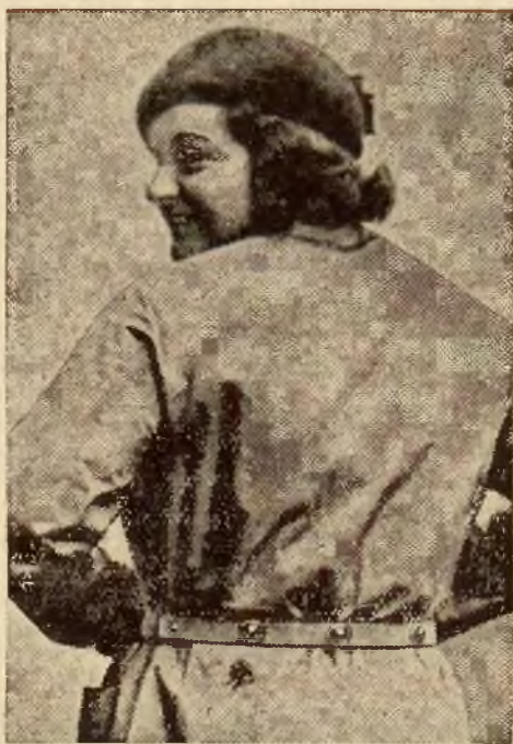
Pasek z trzema reflektorami, który na spacerze po szosie w nocy ostrzeżenie kierownicę, że drogą idzie człowiek.