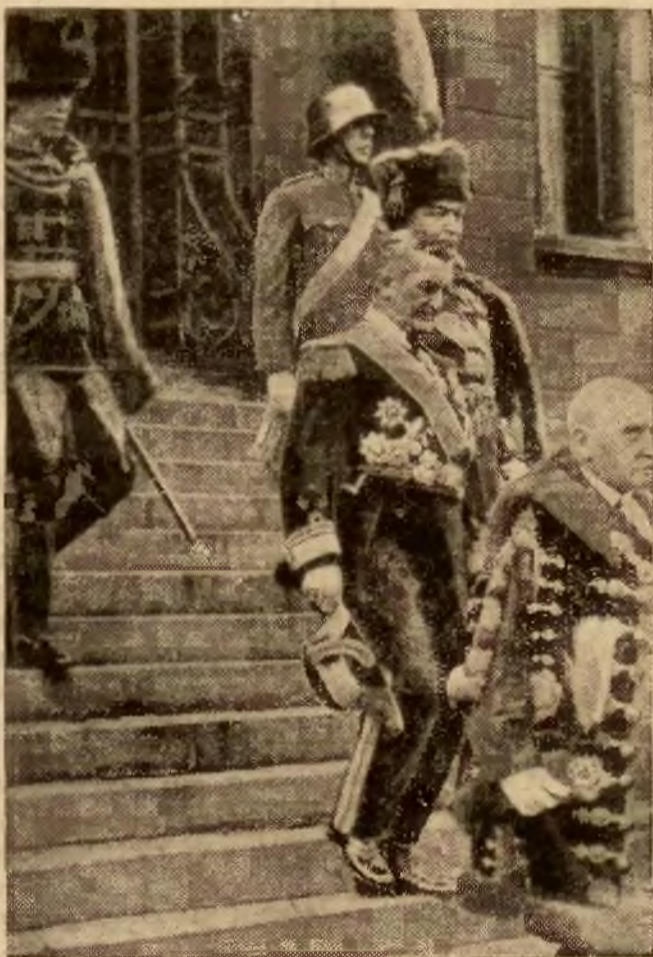
Regent Horthy (drugi z prawej) opuszcza gmach parlamentu po inauguracyjnej sesji powakacyjnej.