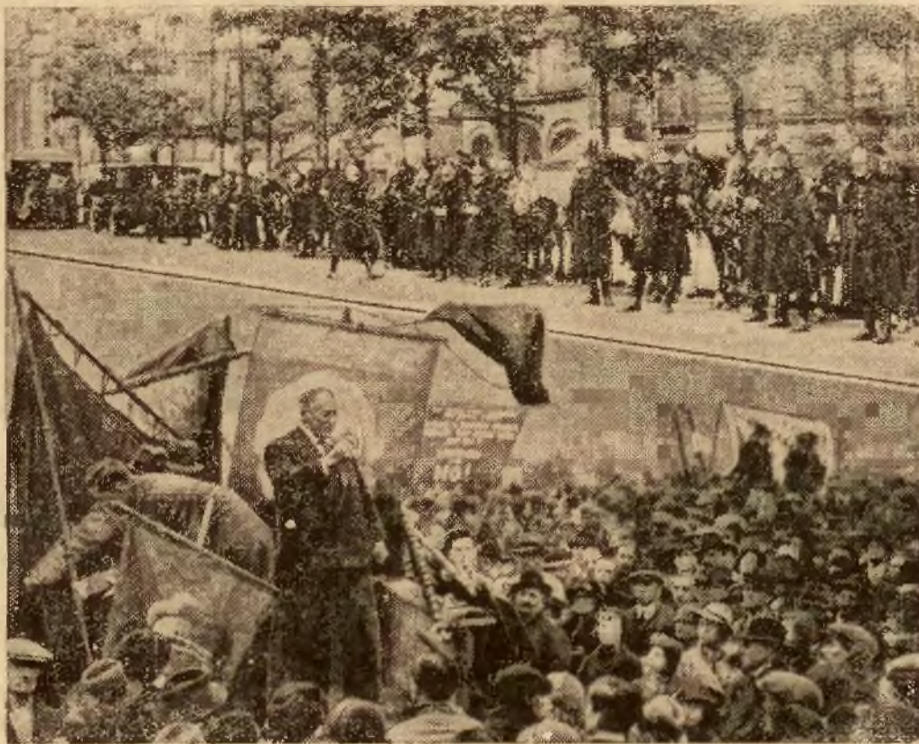
Dzień pierwszego maja w stolicach Francji i Anglii miał zupełnie spokojny charakter. W Paryżu (u góry) skonsygnowano na wszelki wypadek policję i gwardję republikańską, podczas gdy w Londynie, w Hyde Parku odbył się w zupełnym spokoju i porządku.