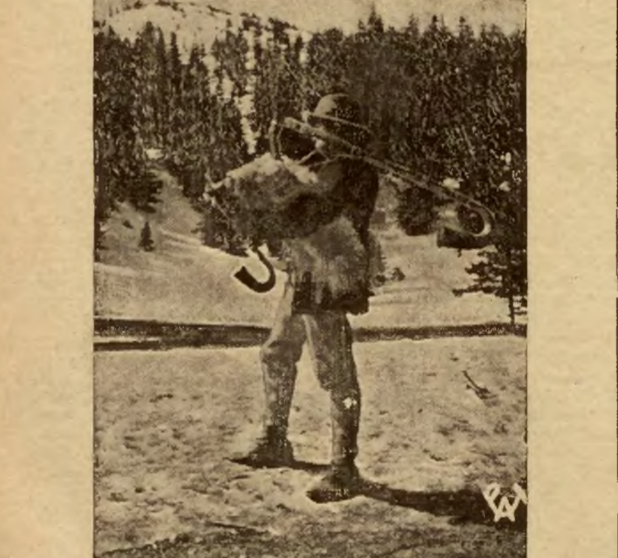
Do sechroniska w Pińsku zawitał góral kobzą entuzjastycznie witany przez narciarzy, używających ostatnich dni śnieżnej pogody.