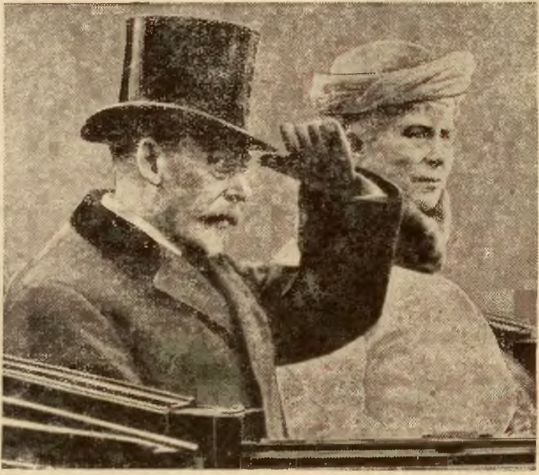
Król Jerzy V-ty i królowa Mary na spacerze. (Najnowsze zdjęcie angielskiej pary królewskiej).