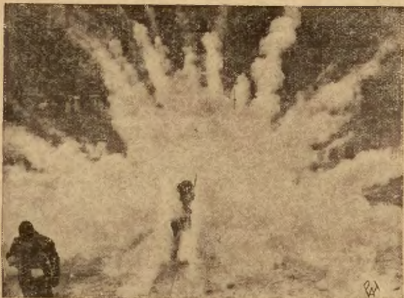
Zdjęcie nasze przedstawia demonstrację nowych bomb wynalezionych przez inżynierów włoskich o niezwykłej sile wybuchowej i powodujących gwałtowny pożar nawet nietłuczalnych obiektów. Bomba ta nosi nazwę: — „Firofuga X”.