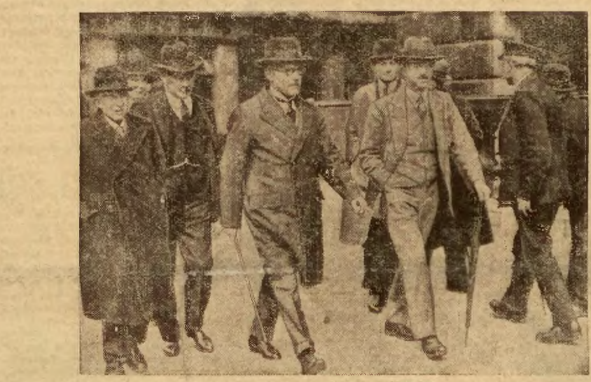
Na zdjęciu premier Wielkiej Brytanji udaje się do gmachu Izby Gmin, gdzie wygłosił oczekiwane z zainteresowaniem w kraju i zagranicą exposé na temat polityki zagranicznej Wielkiej Brytanji.