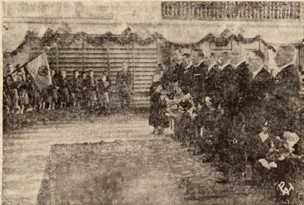
Bawiący w Warszawie szwedzki minister oświaty Enberg zwiedził w towarzystwie ministra W. R. i O. P. Jędrzejewicza i szeregu dygnitarzy szkolnych kilka zakładów naukowych średnich i wyższych. Na zdjęciu — działka szkolna jednej ze szkół powszechnych w Warszawie wita serdecznie mitych gości.