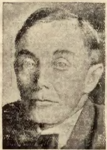
Generał podporucznik sir Philip Game, z zawodu oficer lotnik.