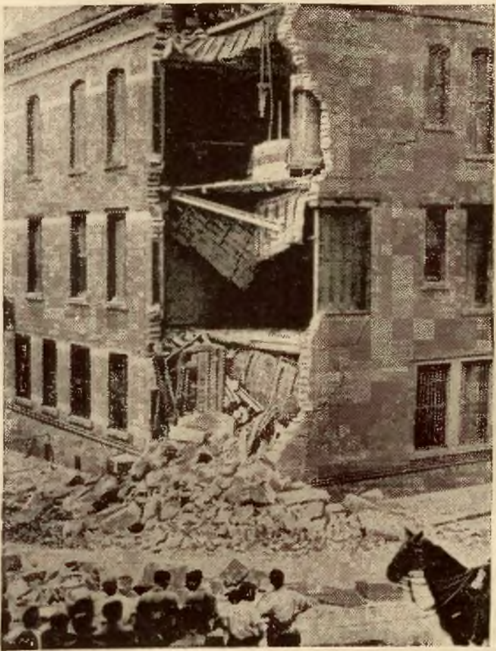
W Barcelonie w biurze tramwajów miejskich wybuchła bomba, podrzuciona przez nieznaną sprawców. Na zdjęciu skutki eksplozji.