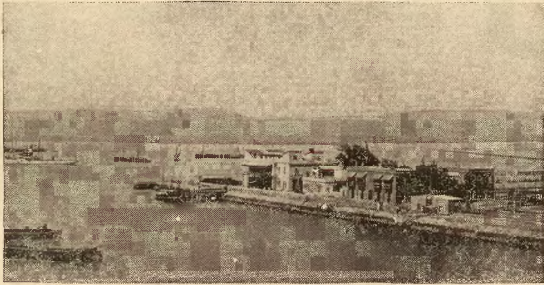
Na zdjęciu kanał Sueski, przez zamknięcie którego, Anglja uniemożliwić może wszelkie poczynania wojenne Włoch w Afryce.