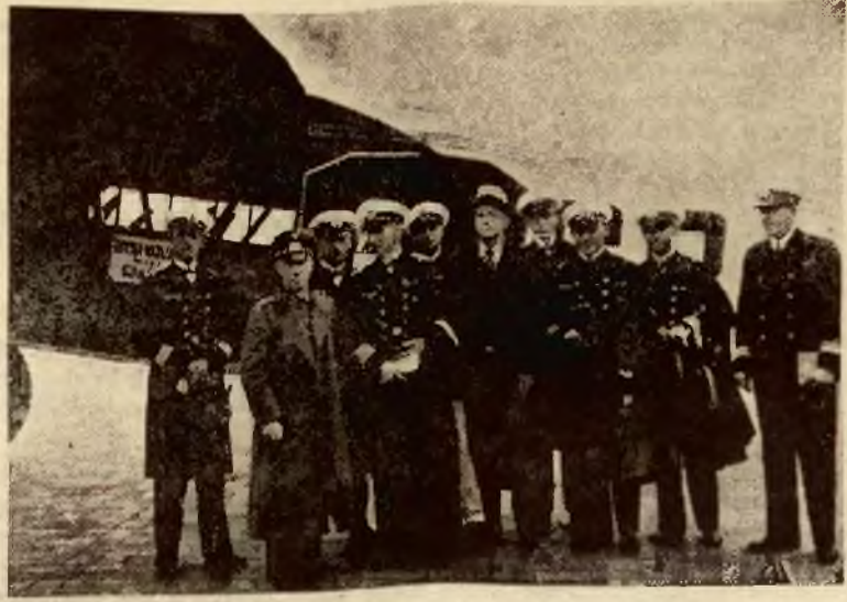
Powitanie marynarki niemieckiej na lotnisku w Warszawie