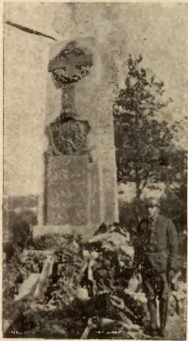
Pomnik Narbutta i towarzyszy wzniesiony staraniem 76 p.p.