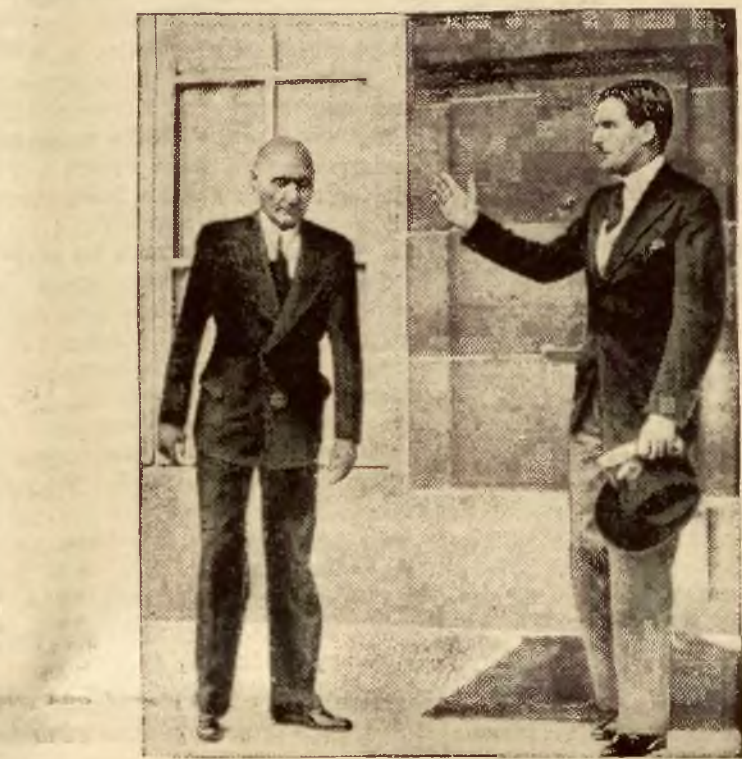
Pełnomocnik Włoch, baron Aloisi (na lewo) i angielski minister dla spraw międzynarodowych Eden, opuszczający Quai d'Orsay po zerwaniu konferencji w sprawie Abisynji.

roku i 5-go maja 1894 r., w których przewidziany był podział Abisynji pomiędzy Włochami i Anglią. Następnie na punkcie 4 u-