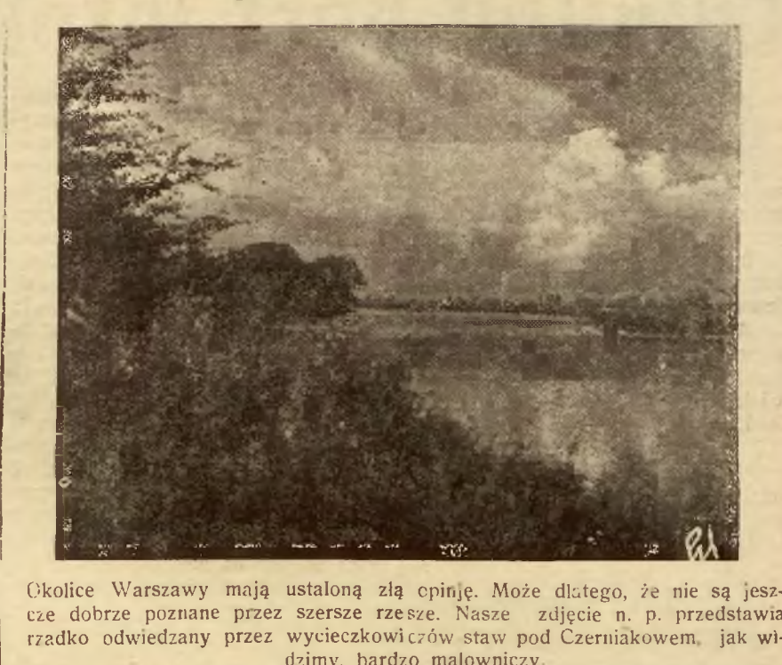
Okolice Warszawy mają ustaloną złą opinię. Może dlatego, że nie są jeszcze dobrze poznane przez szersze rzesze. Nasze zdjęcie n. p. przedstawia rzadko odwiedzany przez wycieczkowiczów staw pod Czerniakowem, jak widzimy, bardzo malowniczy.