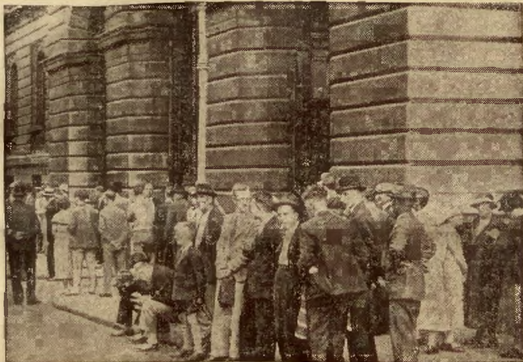
Gabinet angielski konferuje nad konfliktem abisyński - włoskim. Grupy londyńczyków przed Downing - Street 10, oczekują z napięciem wyniku konferencji.